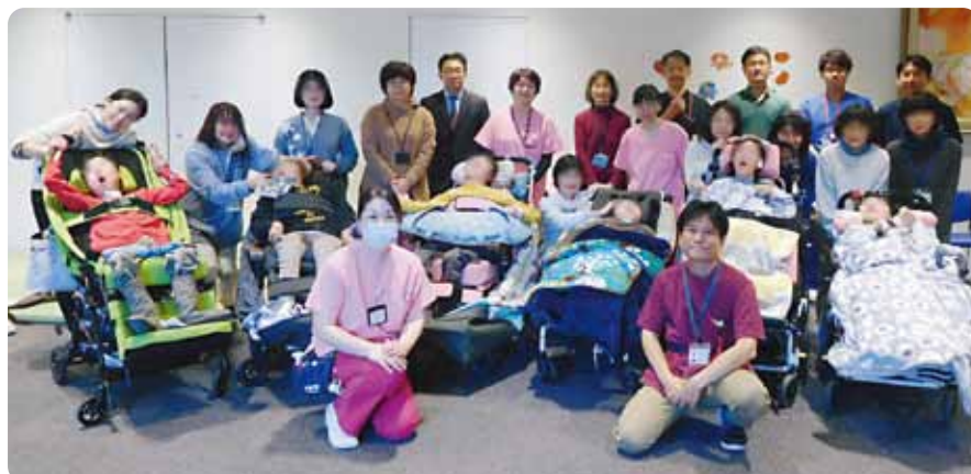
グループ外来参加者の集合写真です。 患者さまやご家族さまの顔は加工してあります。