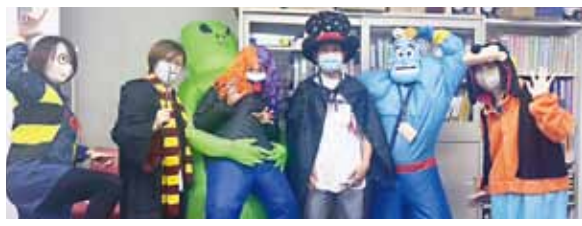
イベントを行った時のスタッフによる仮装隊の写真です

個別療育（製作・絵本の読み聞かせ・タッチング・楽器遊びなど）や季節の行事を行い、関わりの中で気づいたことはスタッフだけでなく、ご家族さまにも伝え共有するようにしています。また、長期入院患者さまを対象に2～4名の集団で行う療育活動を多職種で協力し、患者さま同士が一緒に楽しむ場を提供しています。こちら1病棟では様々な体験ができるように、長期休暇中に、工作、レクリエーション、ドッグセラピー、外部団体を招いたイベントを看護師や心理士と協力しながら実施しています。外来では医師による「在宅人工呼吸療法部門グループ外来」「遺伝診療グループ外来」「胃ろう・栄養部門グループ外来」を開催しており、保育士もスタッフとして協力・参加しています。