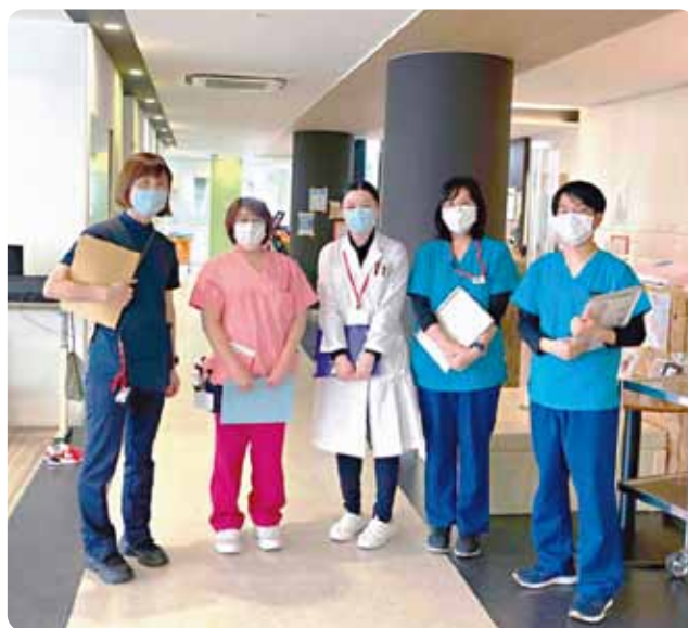
毎週月曜日に行っているNST回診の様子です

栄養だけですべての病気や体調不良が治るわけではありません。ですが、すべての病気や体調不良に立ち向かい、幸せで元気な生活を送るための源が食事であり栄養です。ご不安や相談などあれば遠慮なくお問い合わせください。外来では第3木曜日「胃ろう・栄養外来」が、入院では各病棟のNST委員が窓口となっています。看護スタッフにお問合せ下さい。