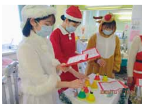
サンタとトナカイの衣装に着替えて いつもと違う印象の保育士さんたち

★3月1日に振り返り会を行いました。今年度の病棟目標に対する評価を保護者・後見人に伝えました。参加された保護者・後見人は6家族でしたが、会の最後に懇談する時間を設け意見交換することができました。