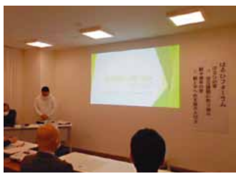
フォーラムの様子

2024年2月9日に、はるひフォーラムを開催しました。年に1度、他部署の職員も参加して、はるひの家と親子療育の家での取組を発表しています。はるひの家からは自立課題の取組について、親子療育の家からは親と子への支援の大切さについて発表がありました。参加者からは「大切にしている支援内容が伝わってきた。」「同センター内の他施設について理解が深まった。」等の声がありました。今後も職員の資質向上を図りながら、支援に活かしていきます。