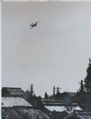
名古屋市初空襲のB25の写真

戦前、航空機生産の一大拠点であった名古屋。その名古屋が狙われた空襲は、60回以上に及びました。戦時中、愛知県と名古屋市は、国策に沿って、爆撃目標となる軍需・航空機工業に係る重要工場の防空政策を決定し、延焼を防ぐための建物疎開空地を強力に進めたことで、防空都市名古屋と言われるまでになりました。