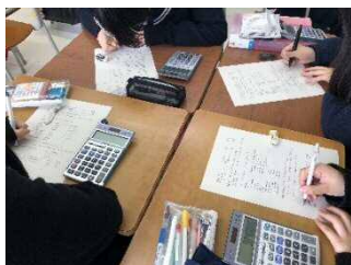
金額を計算している様子

具体的な業種（脱毛サロン経営）における会計を学ぶことで、経営する側からの視点でサービスの提供について考えた。ランニングコストを変動費と固定費に分け、損益分岐点の客数（1か月単位、1日単位）はどのくらいになるのか。また、開業の際の初期費用にいくら必要で、どのくらいの期間で回収できるか。これらを考えるために自身が1か月に脱毛サロンに支出してもよいと思う金額から管理会計の要素を交えて具体的に計算した。気づきや考える幅が大きく広がり、費用をどのように抑えるか、収益をどのように上げるか生徒同士で意見交換し、利益を上げるための工夫を考えていた。また、中小企業白書の開業・廃業によるデータとローン契約とを結び付け、メリット・デメリットとともに契約時に気をつけるべきことまで、考えを深める時間にもなった。