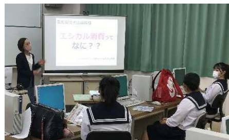
エシカル消費に関する講義の様子

愛知県県民生活課の担当者から「エシカル消費」について講義を受けた。「エシカル消費」という言葉を知らない生徒ばかりであったが、エシカル消費をしているかどうかのチェックリストを実施した結果は、ほとんどの生徒がマイバッグを持参していたり、ごみの分別を心がけていたり、多くの生徒がエシカル消費に取り組んでいたことが分かった。なかにはすでにフェアトレード商品を購入し、持続可能な社会に向けて自ら考えて消費行動をしている生徒もいることを知ることができた。