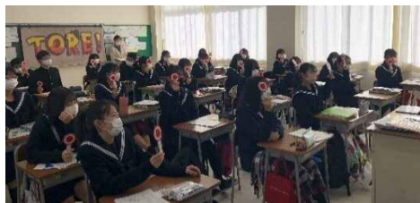
実践的授業の様子

愛知県県民生活課と愛知県消費生活センターと連携し、「若者を狙う悪徳商法」について、消費者庁作成教材「社会への扉」を活用した「実践的授業」を行った。実際に起こった事例をクイズ形式で紹介され、生徒が積極的に参加しやすく理解を深めることもできた。悪徳商法について学ぶだけでなく、今年多く見られた事例や講師の体験談を織り交ぜながら講義が展開されたため、非常にわかりやすく、内容が生徒に浸透していった。特に、断ることの大切さや困った時には消費生活センター（消費者ホットライン188）に相談することの重要性を強調されており、生徒が行動に移せる土壌を確立していただけた。