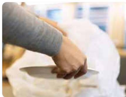
食品を廃棄する様子