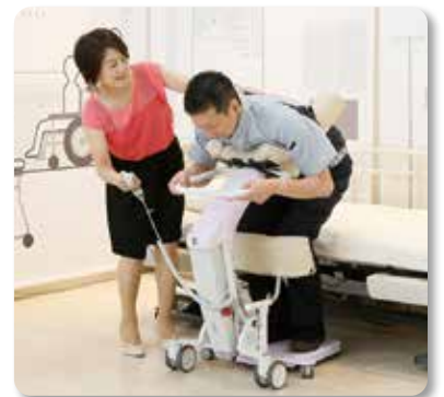
介護ロボットを使用する人