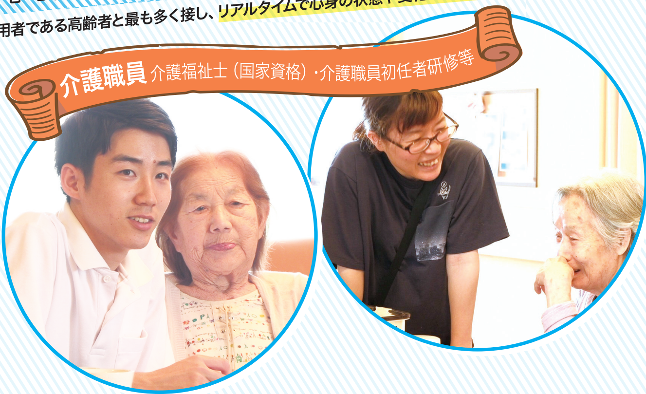
介護職員 介護福祉士（国家資格）・介護職員初任者研修等

利用者である高齢者と最も多く接し、リアルタイムで心身の状態や変化を把握し、理解しているのが介護職員。