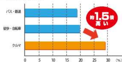
■通勤手段と肥満率