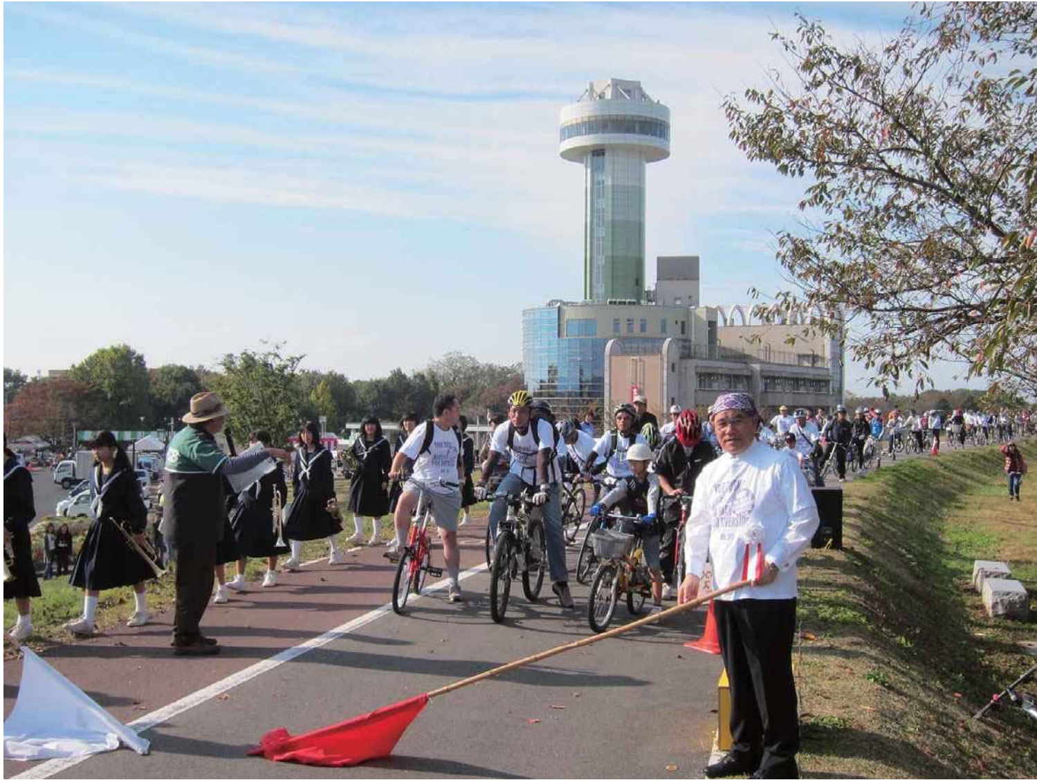
2011年 江南自転車散歩のスターターは市長にお願いした