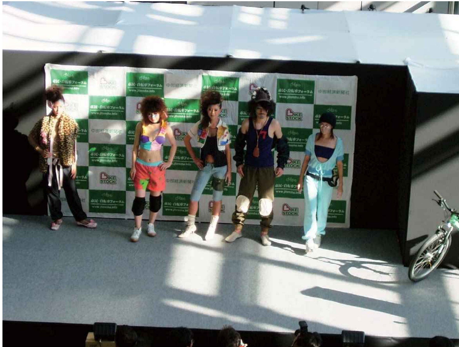
2004年 デザイン専攻の学生がデザインした自転車ファッションショー