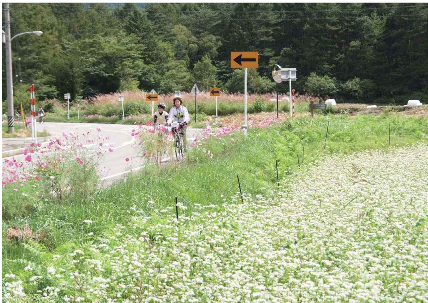
2009年 きそふくしまスキー場を拠点に開田高原方面を廻った自転車散歩