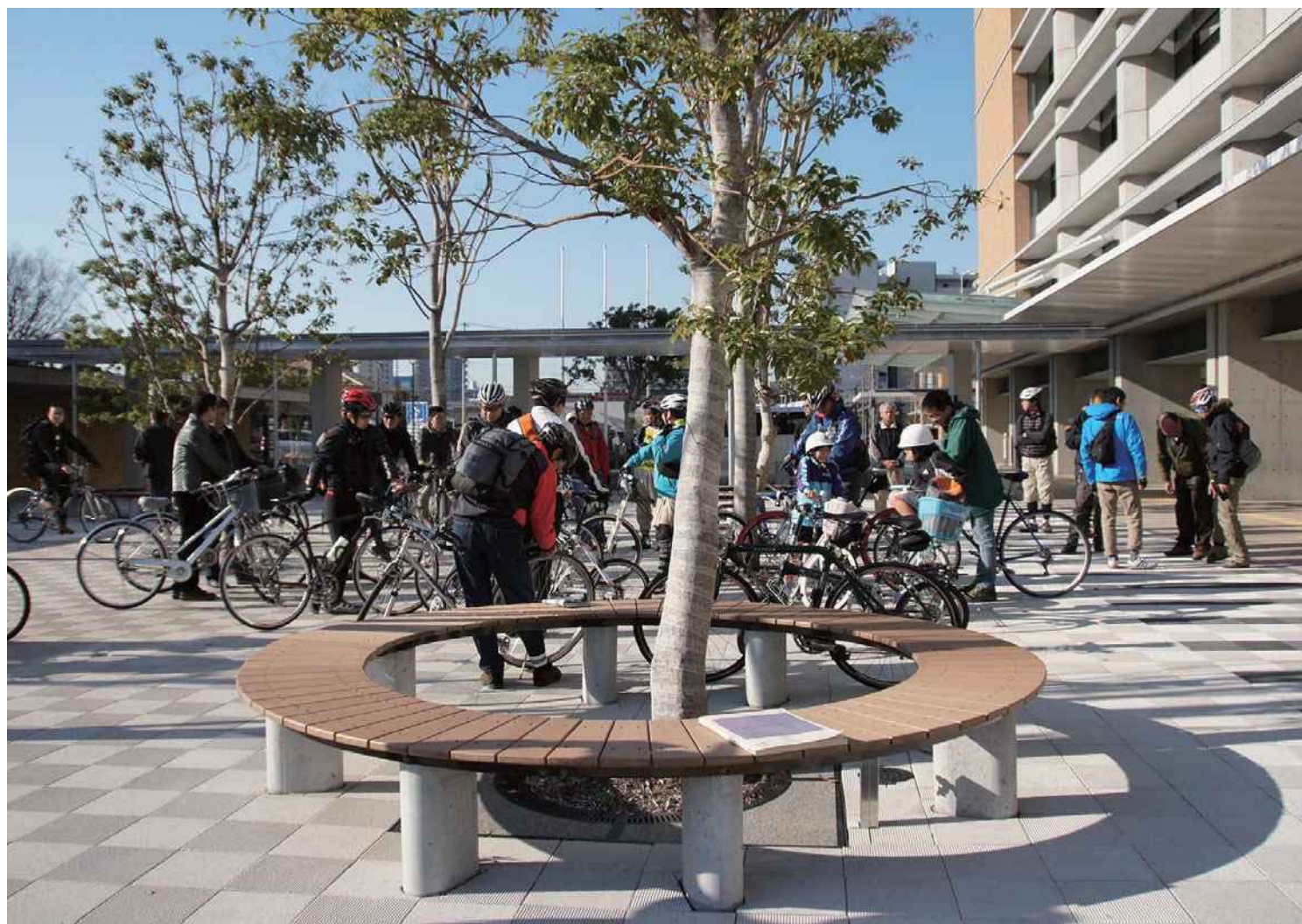
2011年 刈谷自転車マップのワークショップ調査走行の出発