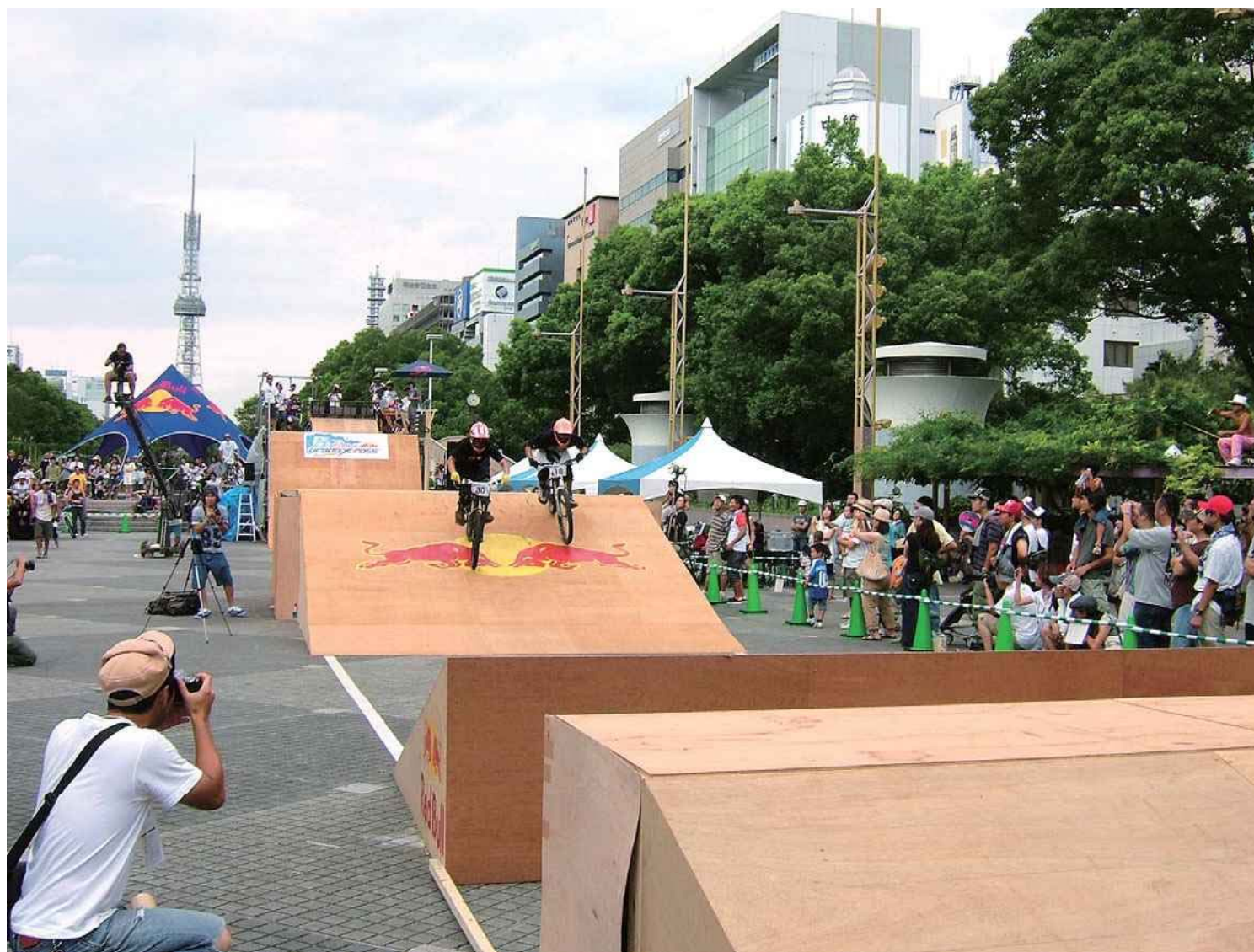
2008年 Red BullのアーバンXを久屋大通公園で企画・運営