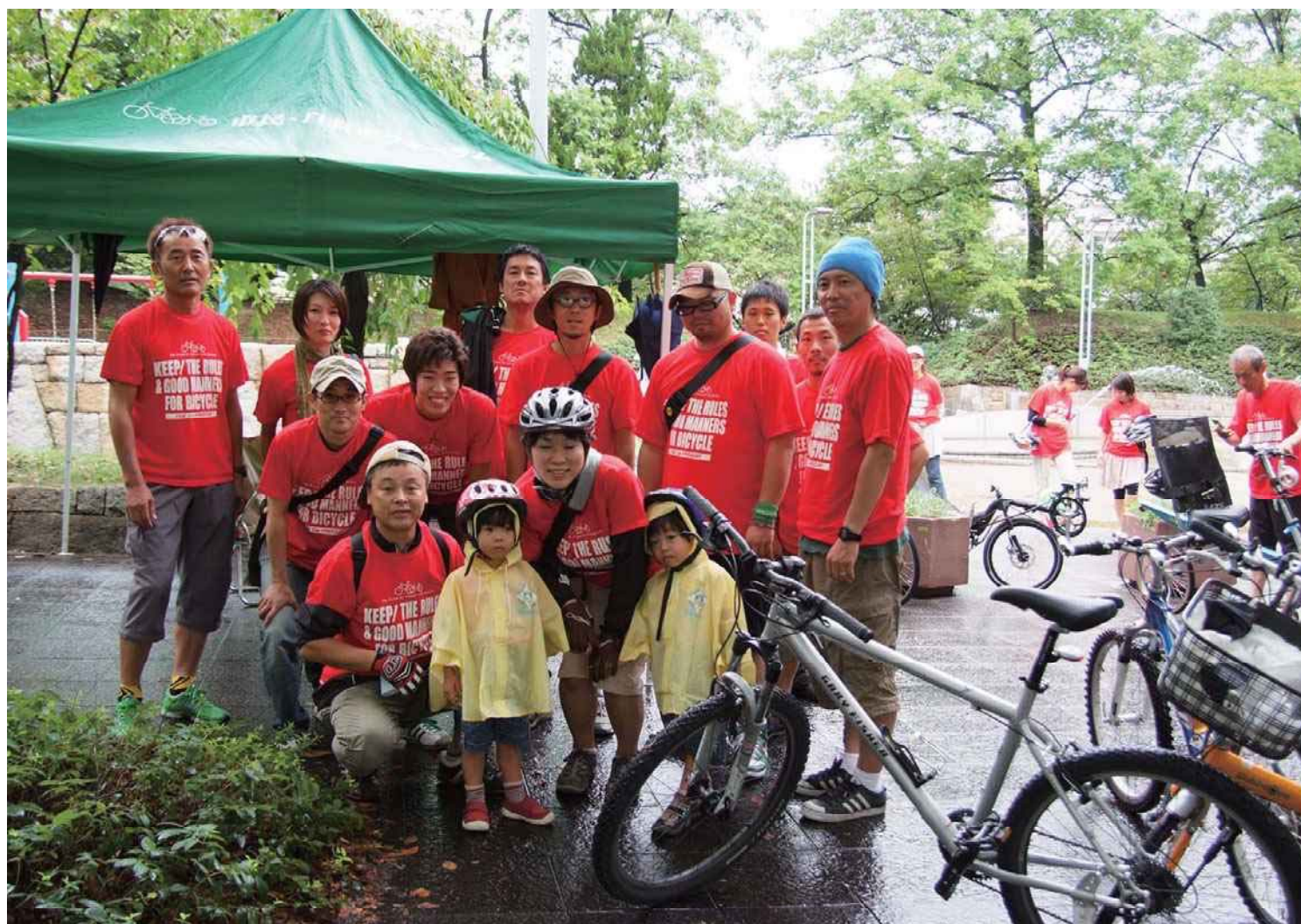
2008年 メッセージは KEEP THE RULES & GOOD MANNERS FOR BICYCLE