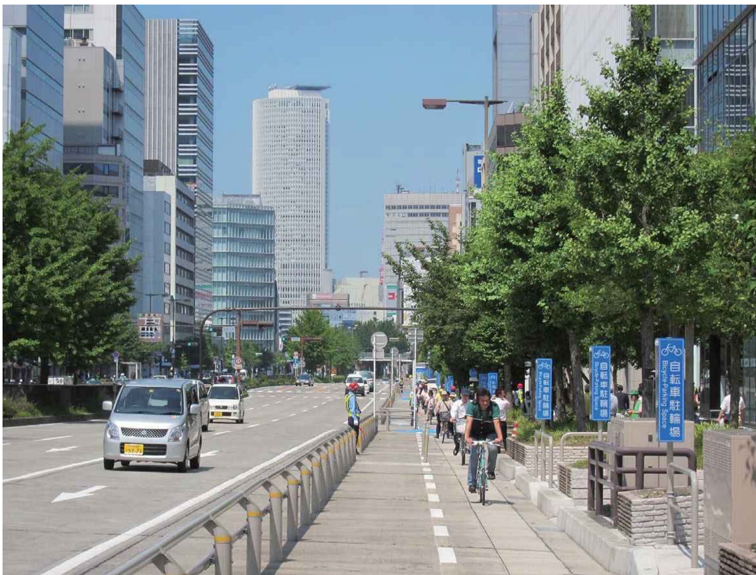
2011年 2年がかりの会議を重ねて完成した桜通自転車道