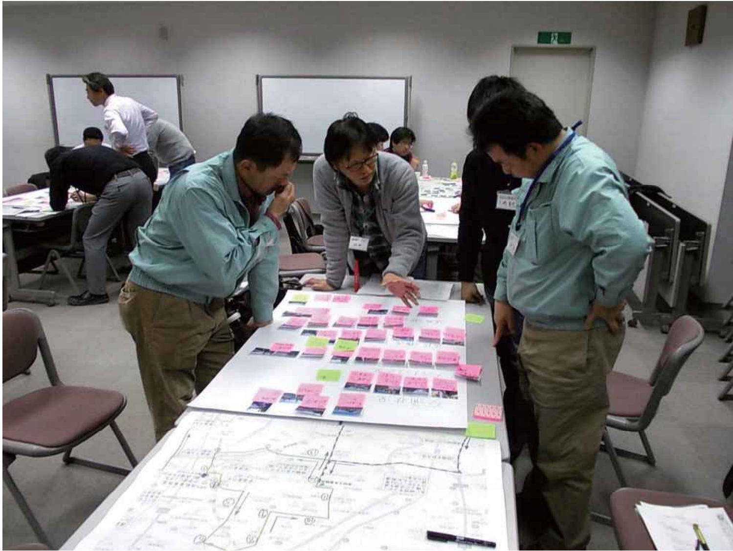
2014年 名古屋環状線内の道路状況を名古屋市と調査WS