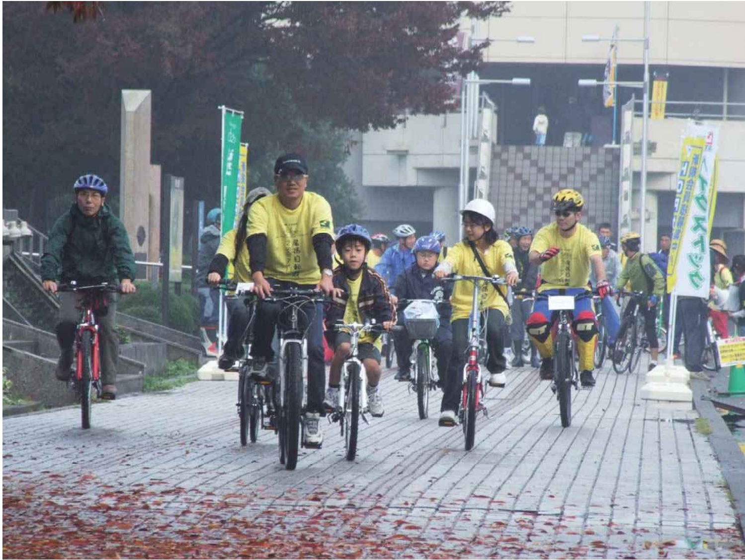
2007年 小雨の中、出発下尾張自転車散歩は参加者約2,000名