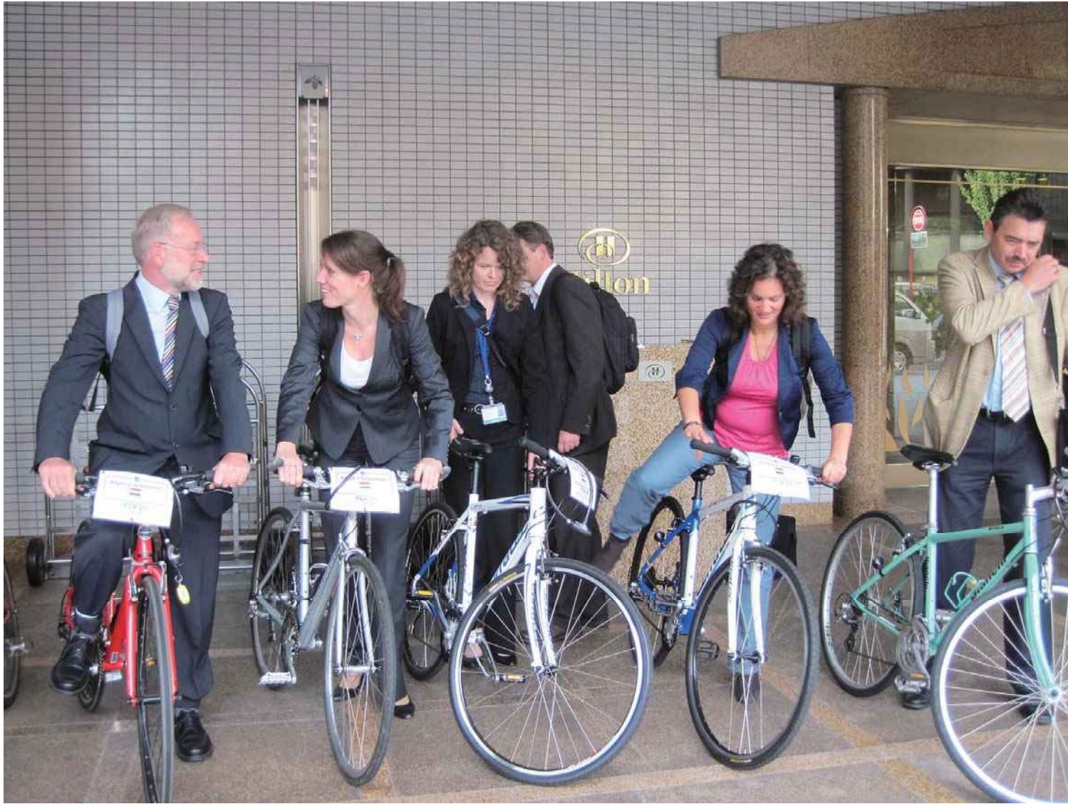
2010年 COP10参加のオランダ大使にレンタサイクル