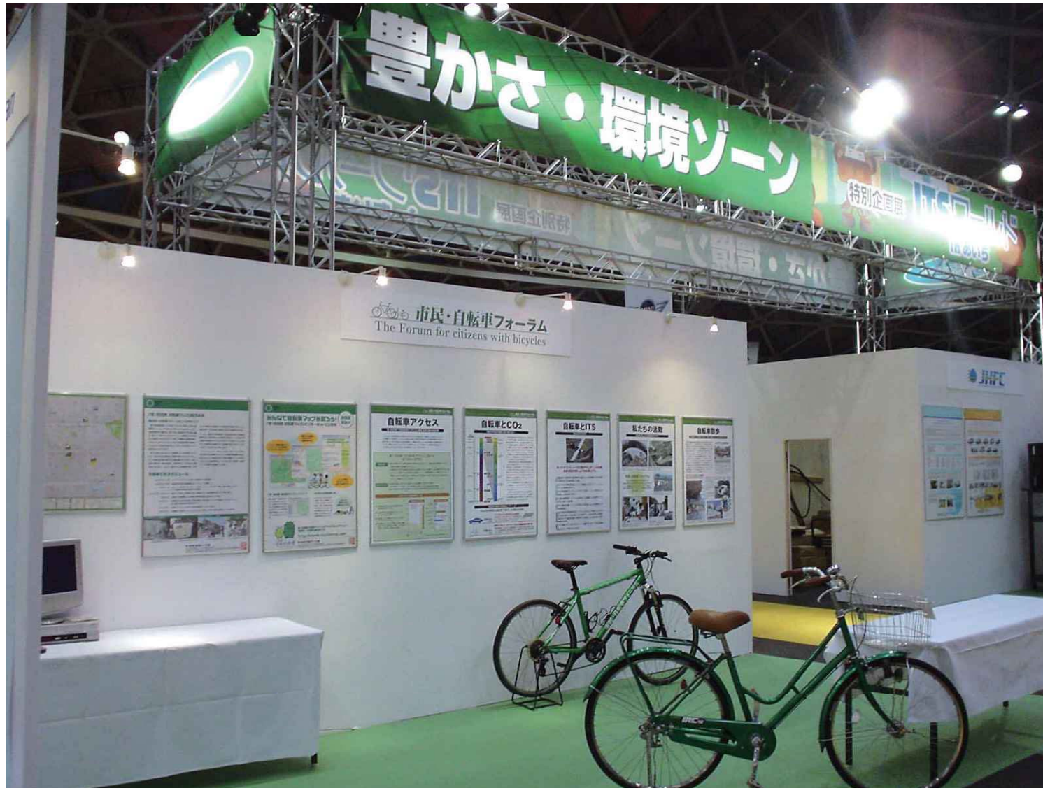
2007年 名古屋モーターショーのITSワールドには毎回出品