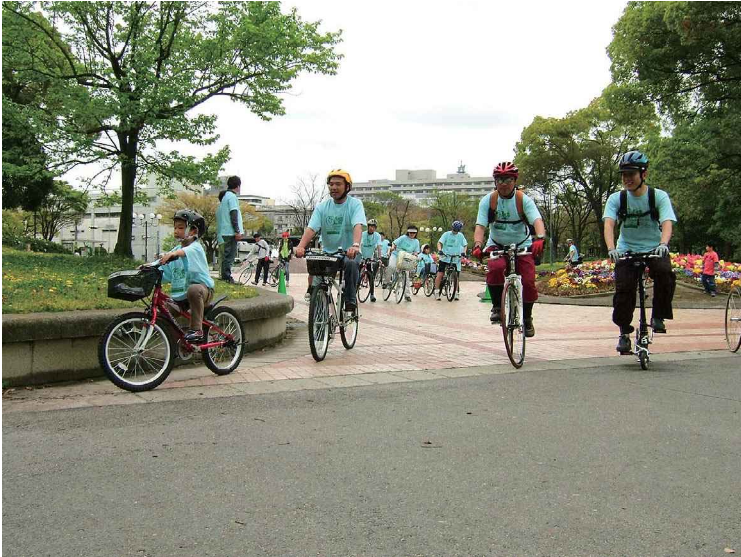
2007年 お揃いのメッセージTシャツを着用して出発する自転車散歩