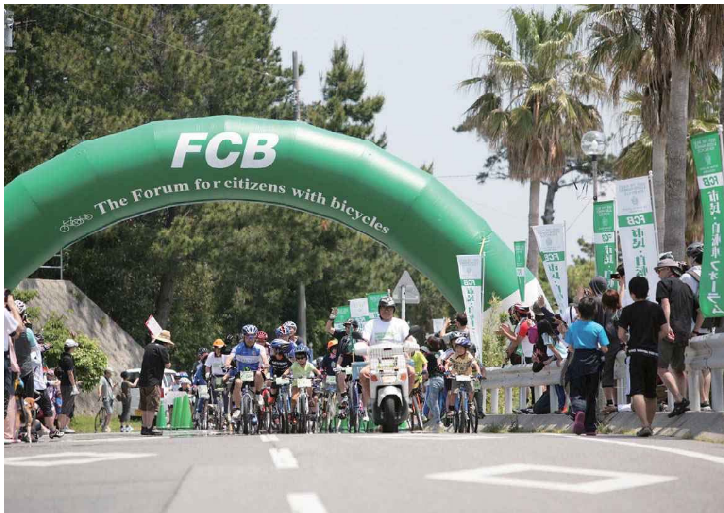
2014年 2003年から毎年開催している市民サイクルパラダイスin日間賀島