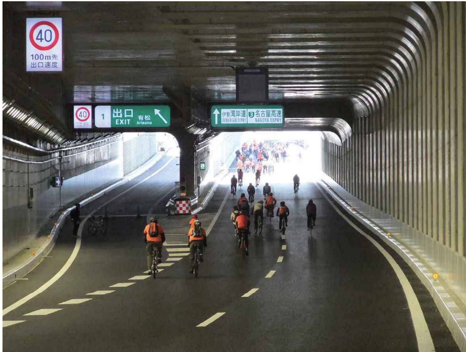
2011年 名二環開通記念イベントでは自転車で高速道路走行