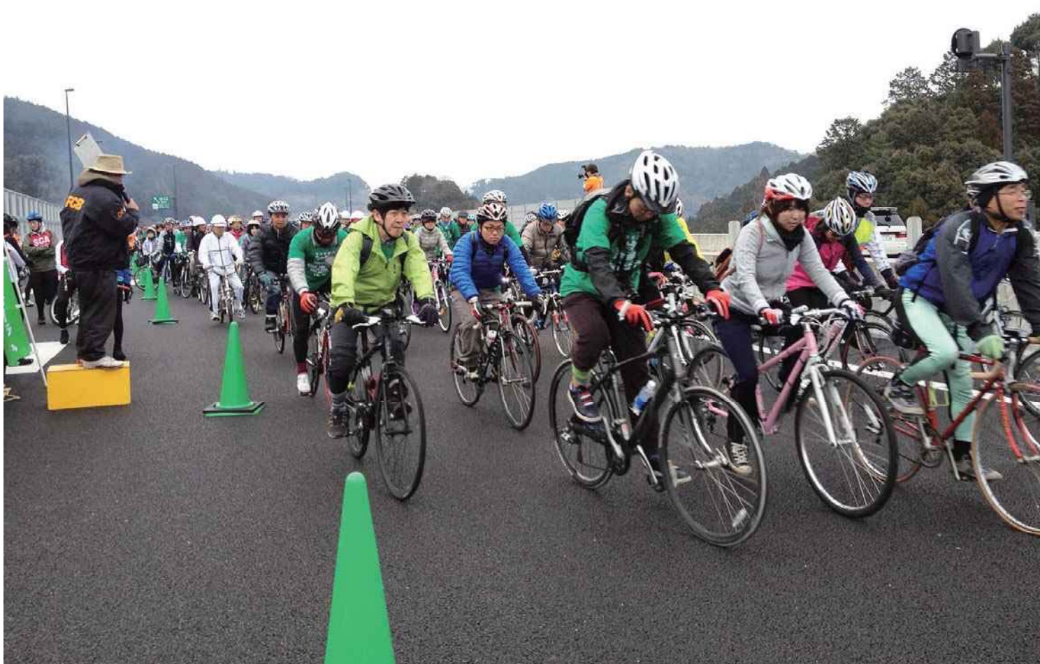
2012年 新東名高速道路開通記念走行は小雨の中スタートした