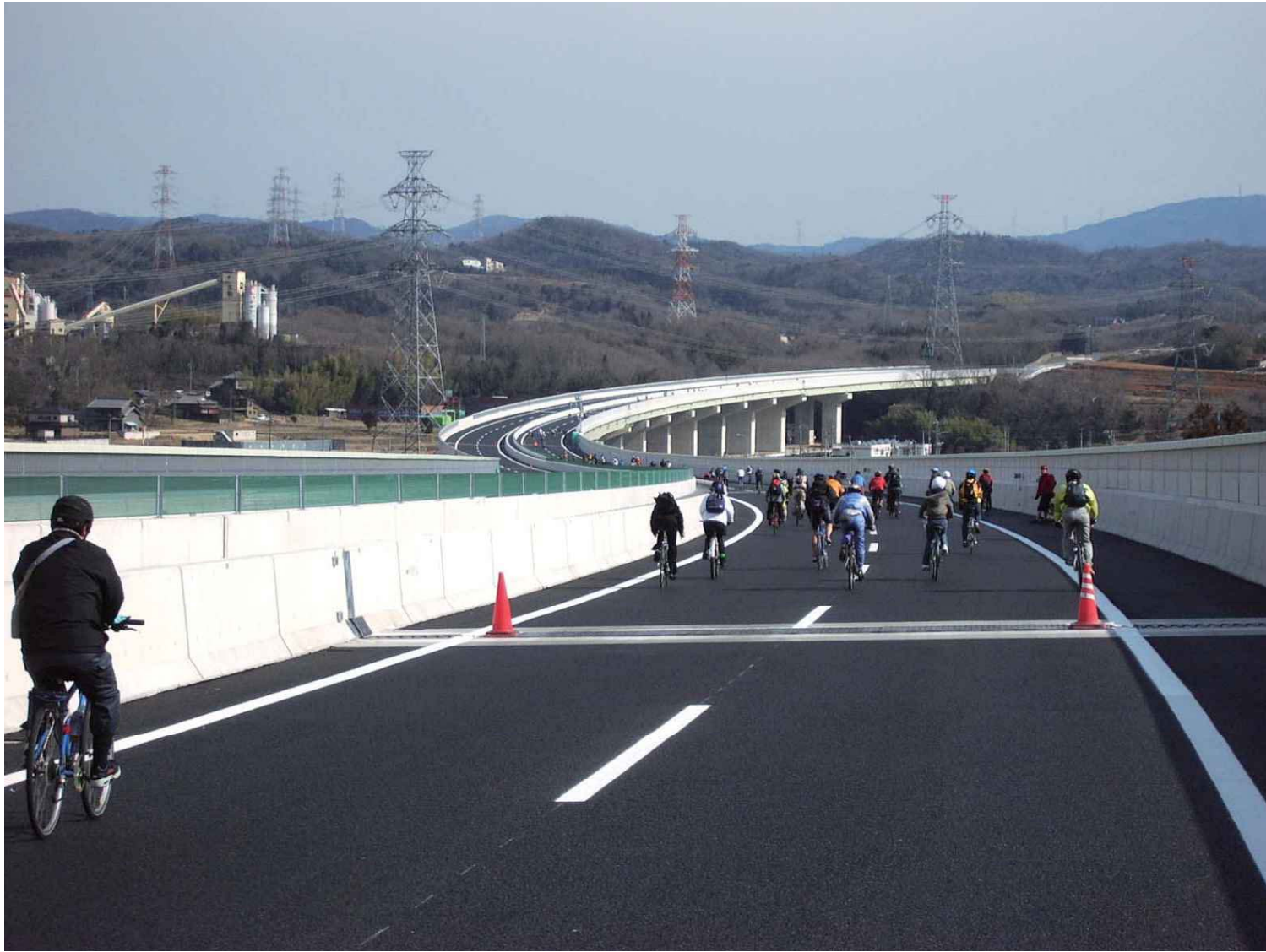
2005年 東海環状自動車道開通記念走行