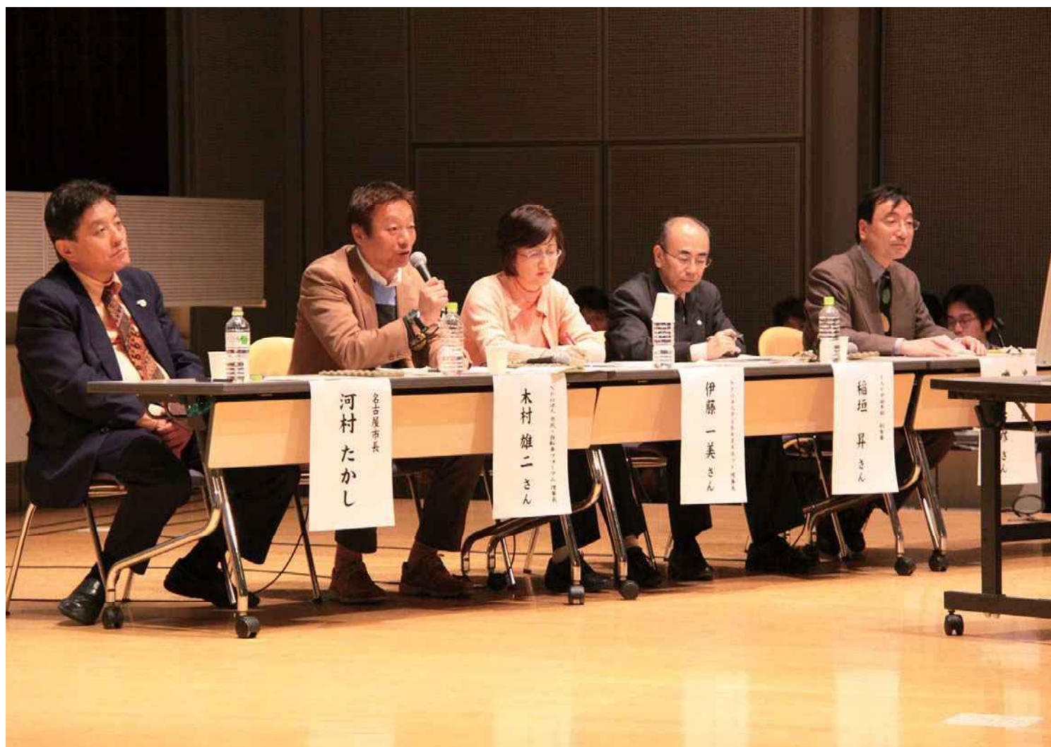
2010年 名古屋市主催の市民大討論会「自転車について話そみやあ」