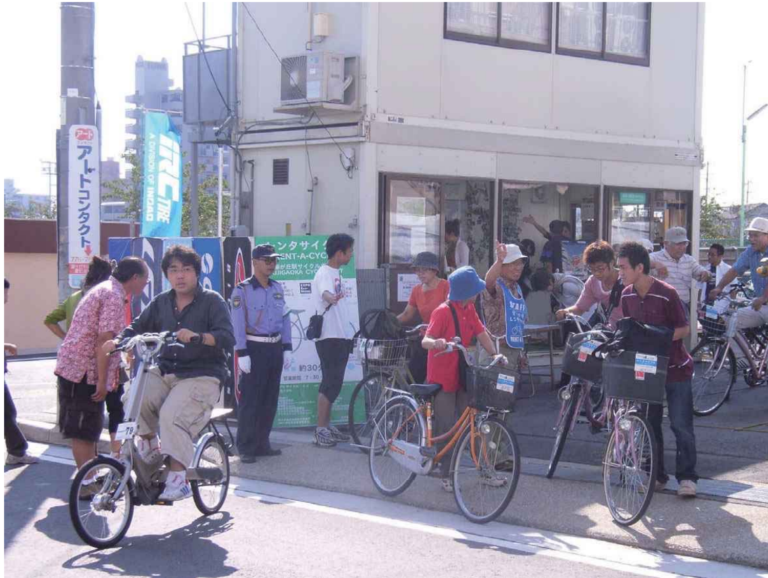
2005年 藤が丘にて愛・地球博開催におけるレンタサイクル