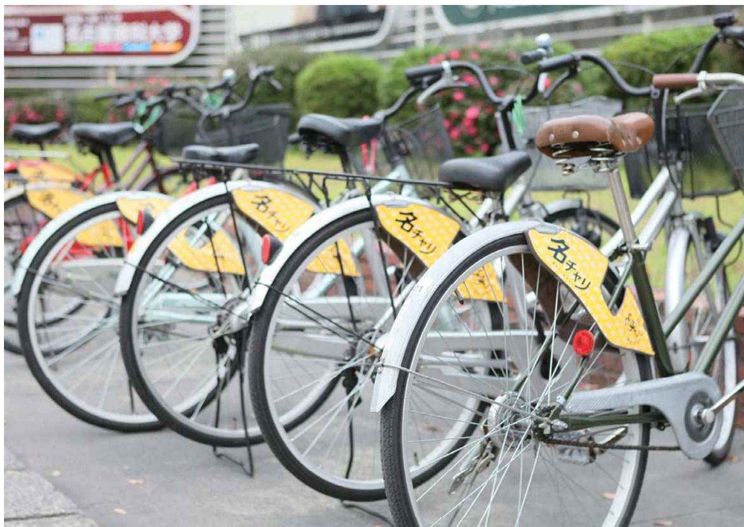
2010年 名古屋市の自転車シェアリングの社会実験「名チャリ」