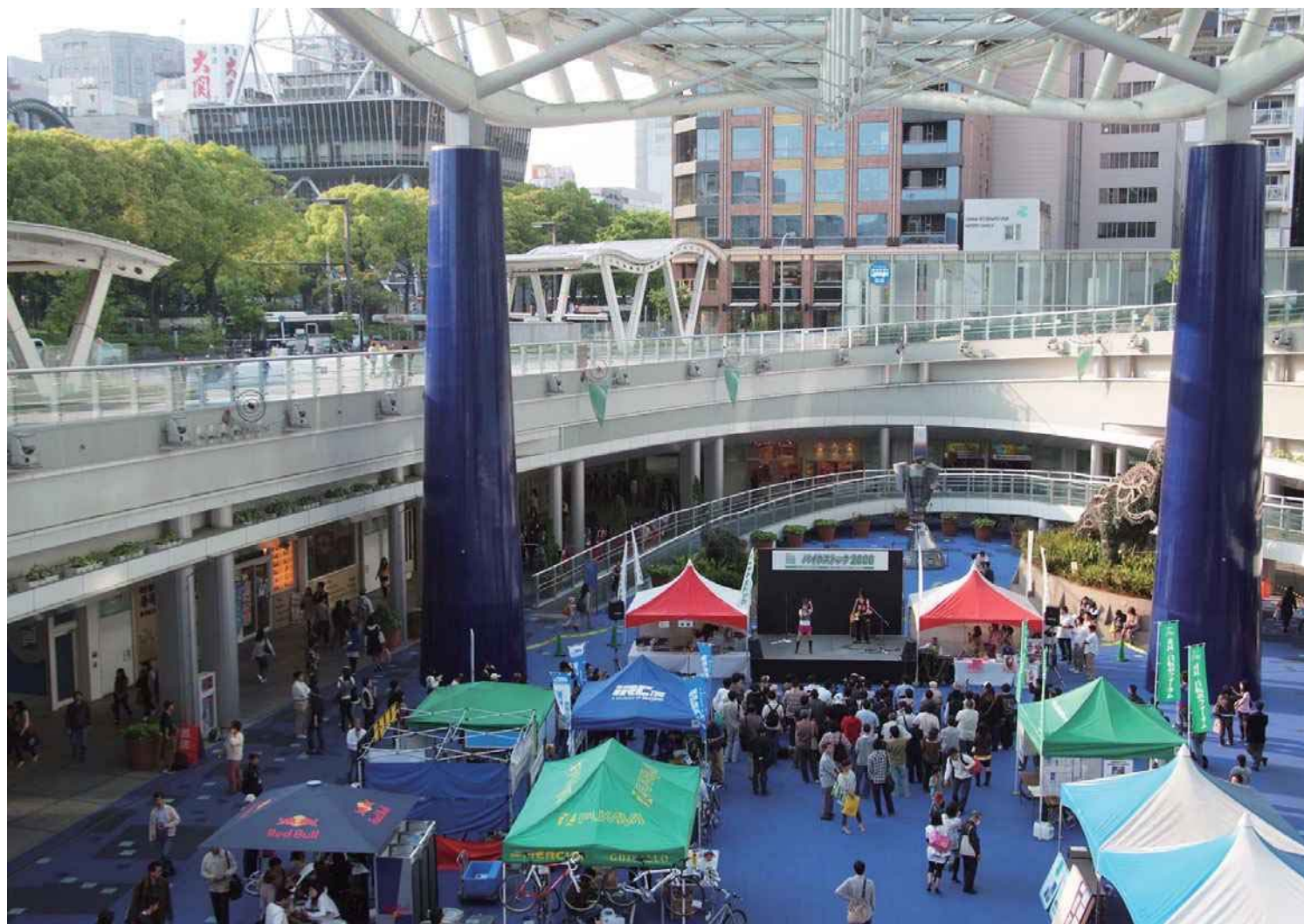
2008年 スポーツ自転車を知っていただくために開催したBIKE STOCK