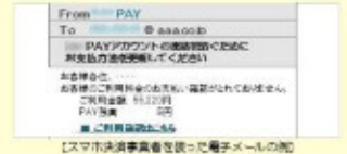
【スマホ決済事業者を装った電子メールの例】