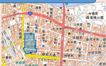
豊橋市松葉町一～二丁目、広小路一丁目