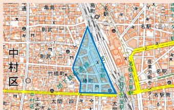
名古屋市中村区椿町