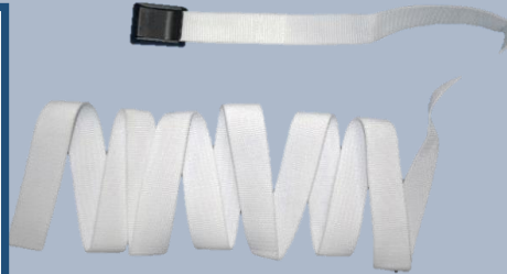
【現場に遺留された結束バンド】 白色化繊製、幅25mm×長さ2m