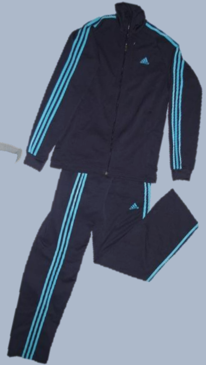
【未発見の被害者のジャージ】 上：Mサイズ、下：Sサイズ adidas社製