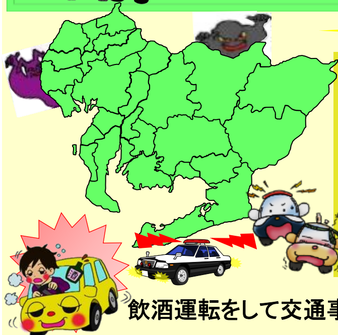
過去5年間月別飲酒運転事故の発生状況(死亡・負傷事故件数)

市民の皆さん知っていますか、愛知県内において 過去5年間 (H25~H29) で飲酒運転による交通事故 がこれだけ発生しています。