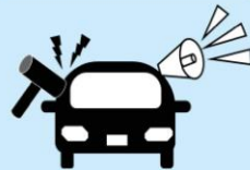
周囲に異常を知らせる警報装置