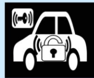
追加のイモビライザー