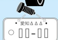
ナンバープレート盗難防止ネジ