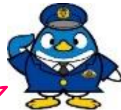
愛知県港警察署マスコットキャラクター

※月曜日から金曜日(祝日、年末年始を除く。) 午前9時から午後5時まで(通話料は有料です。)