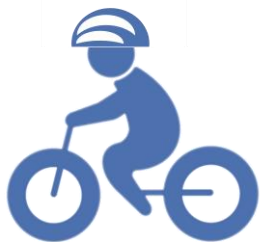
ヘルメットをかぶろう