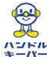
ハンドルキーパー