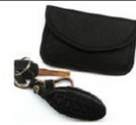
リレーアタック 防止キーケース

リレーアタックは、スマートキーの電波が漏れなければ被害に遭いません。自宅内では金属製の缶にスマートキーを保管するようにし、外出時はリレーアタック対策がされたキーケースが販売されていますので利用してください。（数百円～／インターネット調べ）