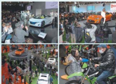
前回の第17回名古屋モーターショーの様子