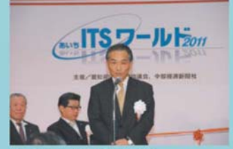
あいちITSワールド 2011の様子