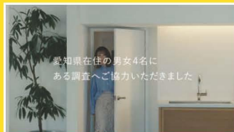
「いいともあいち運動」篇