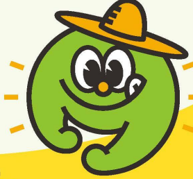
シンボルマーク 「あいまる」