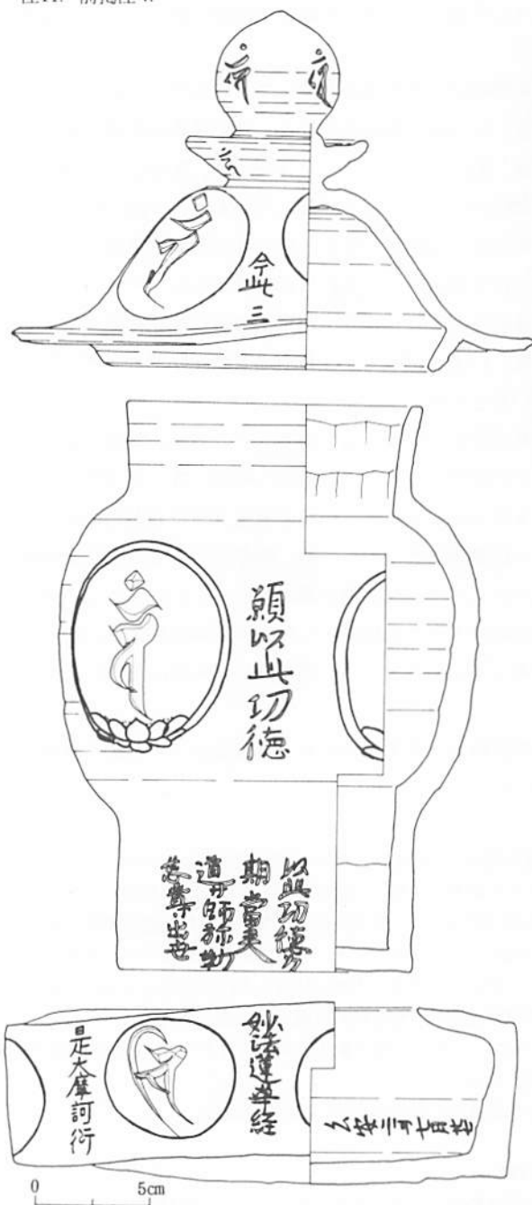
第2図 陶製五輪塔実測図(1/3)