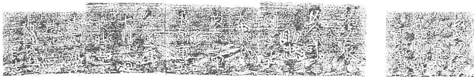
第6圖 水輪下胴部銘文