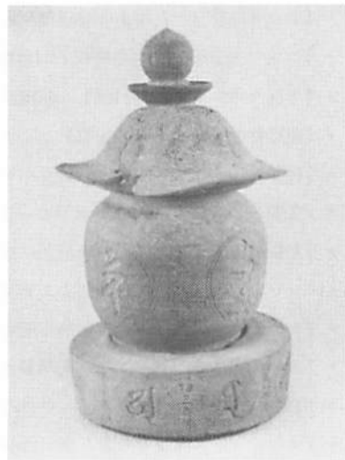
第1図 久安二年銘陶製五輪塔

ところで、この資料のように形状が五輪塔になり、水輪が容器としての機能をもっているものとしては金属製が多く知られているが、陶製のものも若干知られている。これら容器としての水輪をもつ五輪塔は、元来ストゥーバを起源とし、舍利容器である舍利瓶を経て、わが国において創製されたといわれている。また、その収納品も、舍利、舎利の代用品(靱や牛玉)、さらには