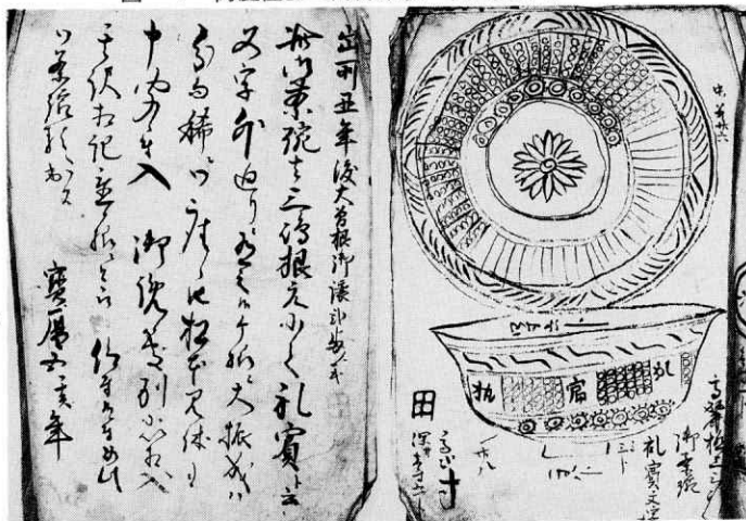
加藤唐三郎家文書 462 (三島茶碗等見取図) より