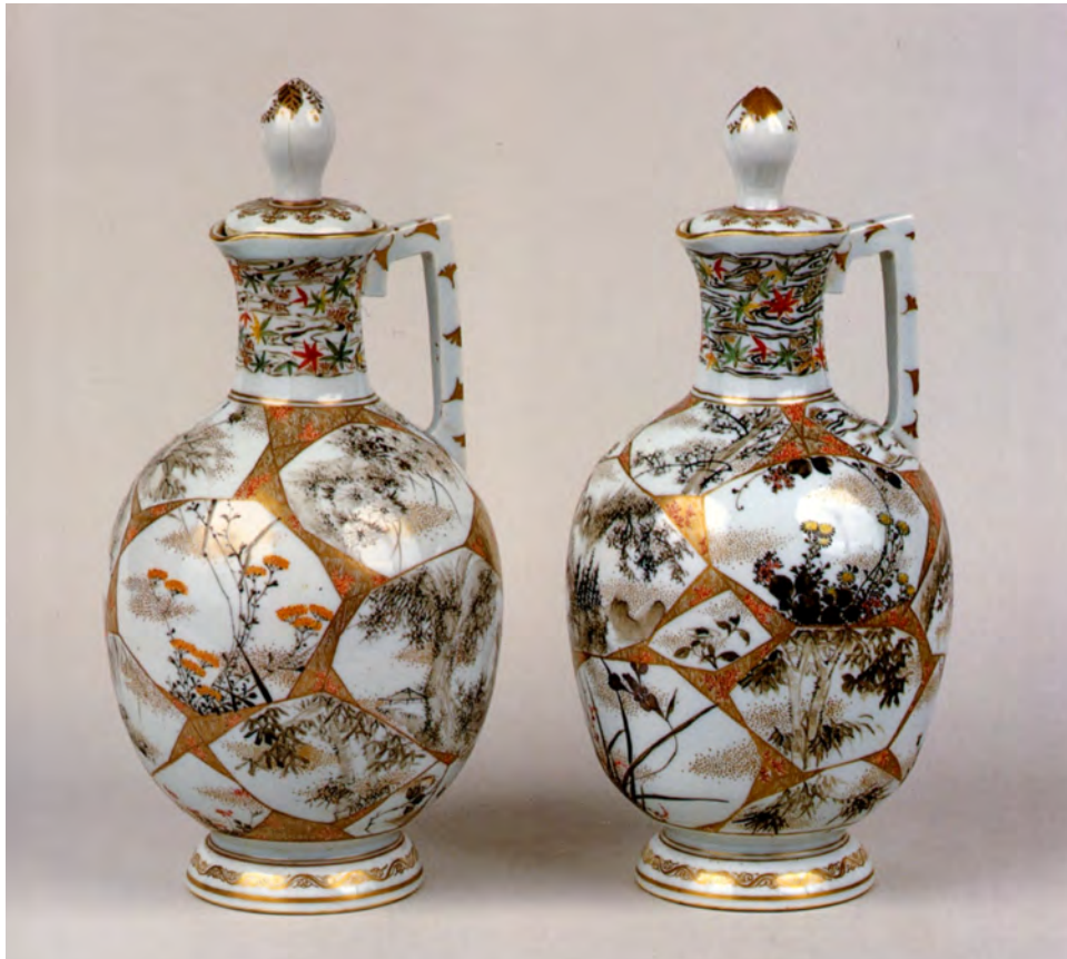
図 24 《上絵金彩花樹図手付瓶》 京都 幹山伝七 明治時代前期（19世紀後期） H28.8