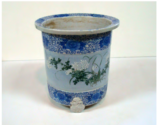
図7 《染付花文鉢》 W:27.8 H:29.3 瀬戸 明治時代