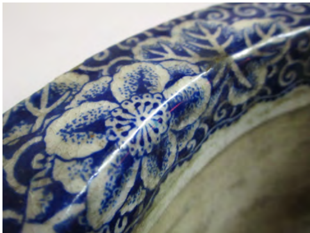
图 20 《藍繪西洋風景図鉢（阿蘭陀写）》 口縁部分