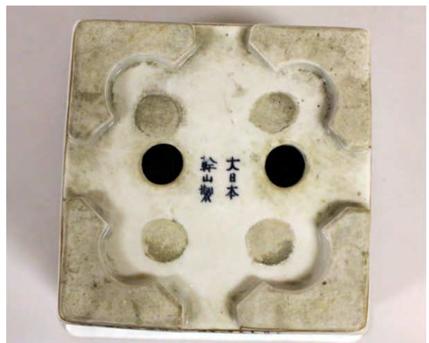
図 27 同左・底部