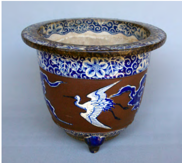
図 23 《阿蘭陀写雲鶴文鉢》 京都か 江戸末～昭和 個人蔵 W:20 H:16