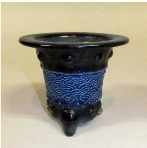
图12 《黒楽イッチン青海波文鉢》 京都か 明治～昭和時代 W: 12.6 H:13.2