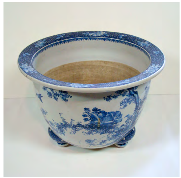
図5 《染付花鳥文鉢》 W:47.2 H:33.9 瀬戸 明治時代