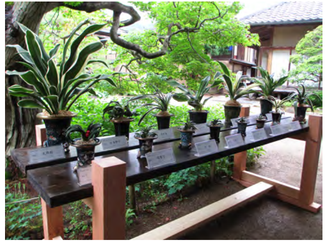
図3 中庭の万年青展示