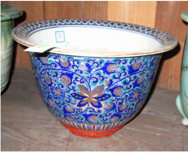
图8 《色絵金彩蝶唐草文鉢》 肥前か 江戸後期～明治時代