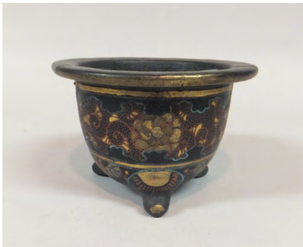
図17 《黒楽上絵金彩牡丹唐草文鉢》 京都か 明治～昭和時代 W:18.4 H:11.8