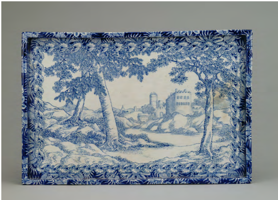
图 19 《藍繪西洋風景図硯蓋（阿蘭陀写）》 W:36.0×24.0 愛知県陶磁美術館蔵