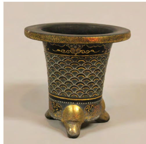
图13 《黒楽上絵金彩青海波文鉢》 京都か 明治～昭和時代 W:12.0 H:12.7