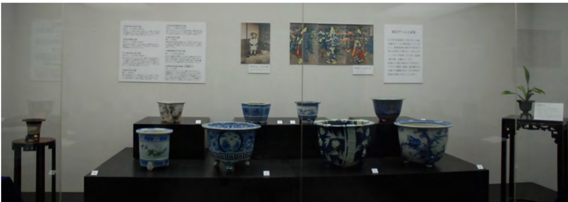
正面 壁面 ケース