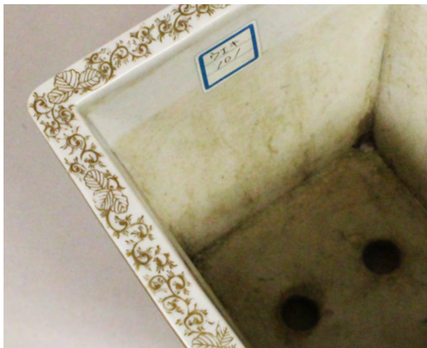
図 26 《上絵金彩山水文鉢》 口縁部分