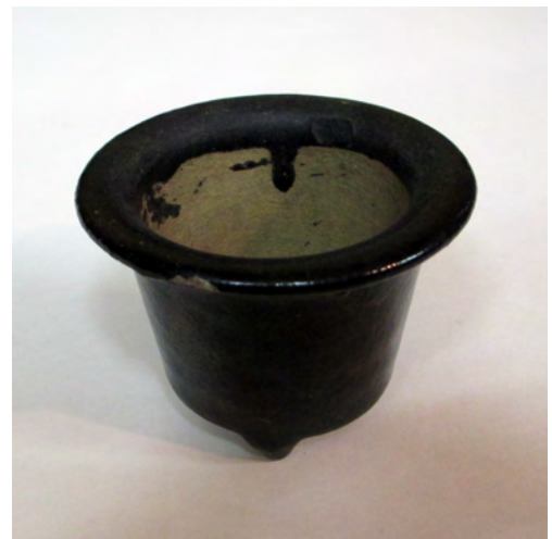
図18 《黒楽鉢》 京都か 明治～昭和時代