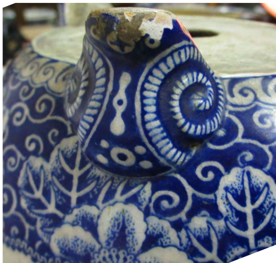
图 22 同上・脚部分