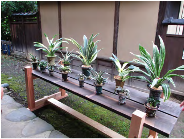
図2 展示室前の万年青展示