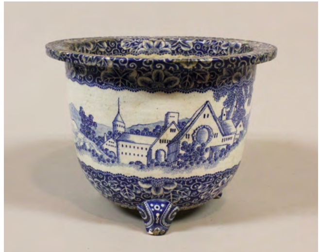
图9 《藍絵西洋風景図鉢（阿蘭陀写）》 日本 江戸後期か W:24.7 H:18.0