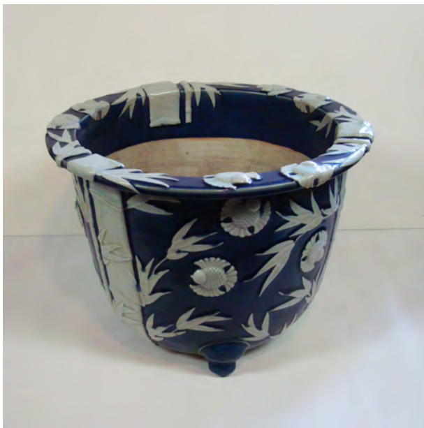
図4 《瑠璃釉貼付竹雀文鉢》 W:47.7 H:35.7 瀬戸 江戸後期～明治時代