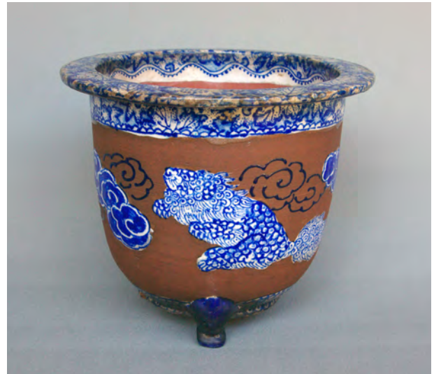
図 24 《阿蘭陀写虎文鉢》 京都か 江戸末～昭和 個人蔵 W:18.3 H:15.5