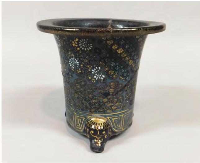
図14 《黒楽上絵金彩鉢》 京都か 明治～昭和時代 W:21.3 H:19.5