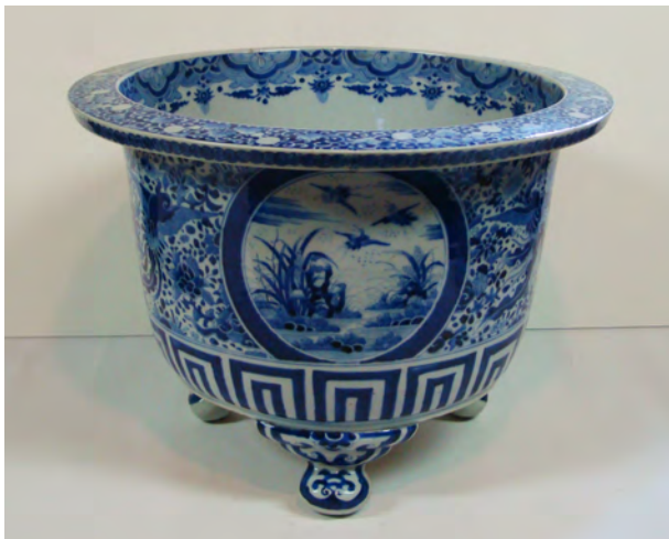
図6 《染付鳳凰文鉢》 W:45.8 H:33.4 肥前か 江戸後期～明治時代