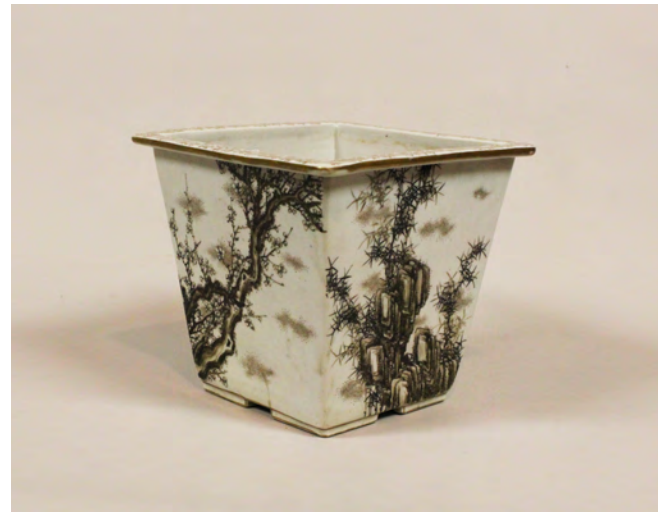
图11 《上絵金彩山水文鉢》 幹山伝七 明治時代 W:19.0 H:17.3