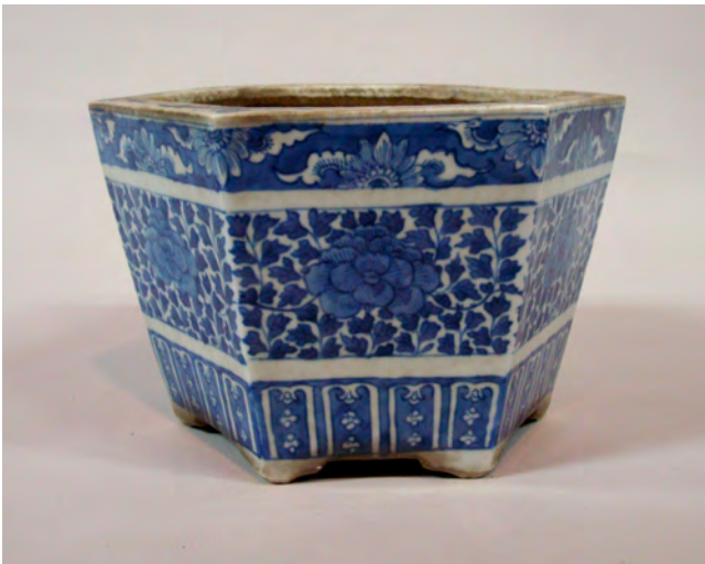
图10 《染付牡丹唐草文鉢》 肥前か 江戸後期～明治時代 W:26.6 H:17.0