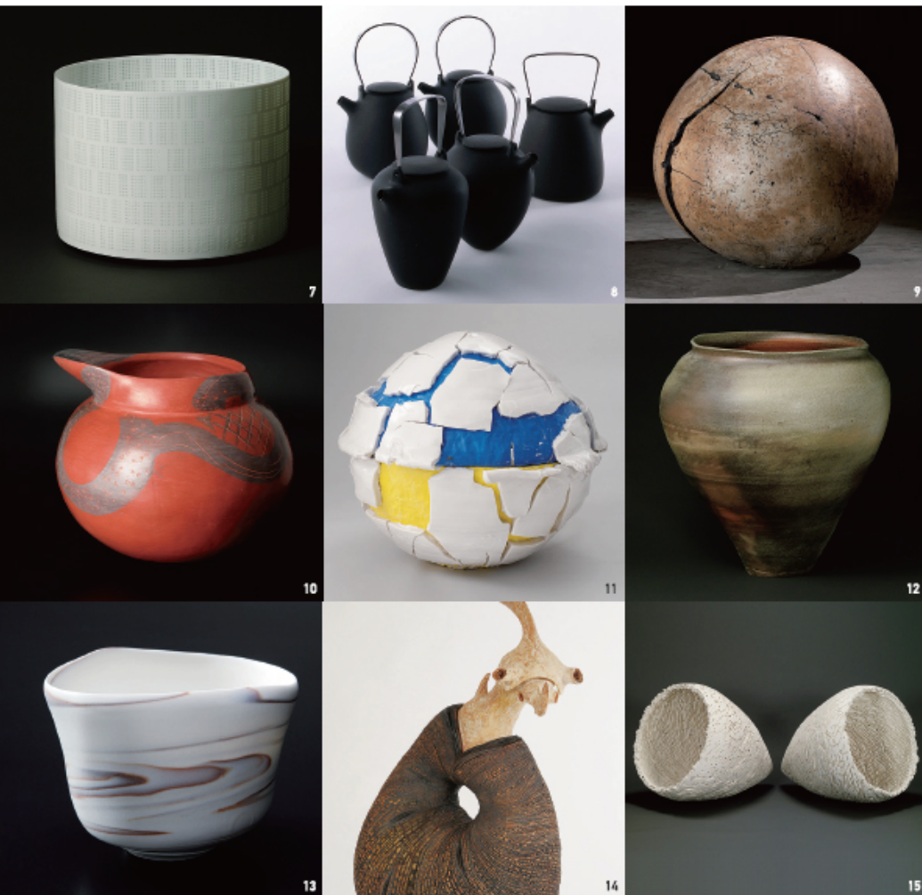
[1]岩淵寛「椿文壺」2010 [2]五味謙二「彩土器」2011 [3]金峻永「apple」2009 [4]原山健一「Galaxy」2007 [5]田中礼「呉」2011 [6]池田晶一「天使の梯子」2010 [7]新里明士「光器」2011 [8]駒井正人「土瓶」2009 [9]坂野晃平「理II」2007 [10]高山大「紅陶壺」2011 [11]桑田卓郎「青黄化粧梅草皮志野地球」2010 [12]鯉江明「紫縞壺」2011 [13]伊藤秀人「練彩茶碗」2010 [14]甲田千晴「静止した時間IV」2010 [15]古川敬之「不在の骨格 対のかたち」2011

現在の陶芸は、社会の急激な変化や芸術概念の拡大などに直面し、かつての陶磁器生産、あるいは一世代前の陶芸表現とは異なる思考のもとに作品制作が行われています。また、社会との関わりも、従来の「用」概念の範疇に留まることなく、新たな状況下で再構築されています。当館では、2008年に16名による「新進陶芸家による東海現代陶芸の今」展を開催いたしました。本展はその続編です。本展では、中世以来、日本陶磁史をリードしてきた愛知、岐阜、三重の東海三県で制作する新世代の陶芸家15名の作家を通じて、多様な陶芸表現の現状を紹介するとともに、新世代の陶芸家ならではの視点と思考を通じて、陶芸表現の今日における可能性を考えます。