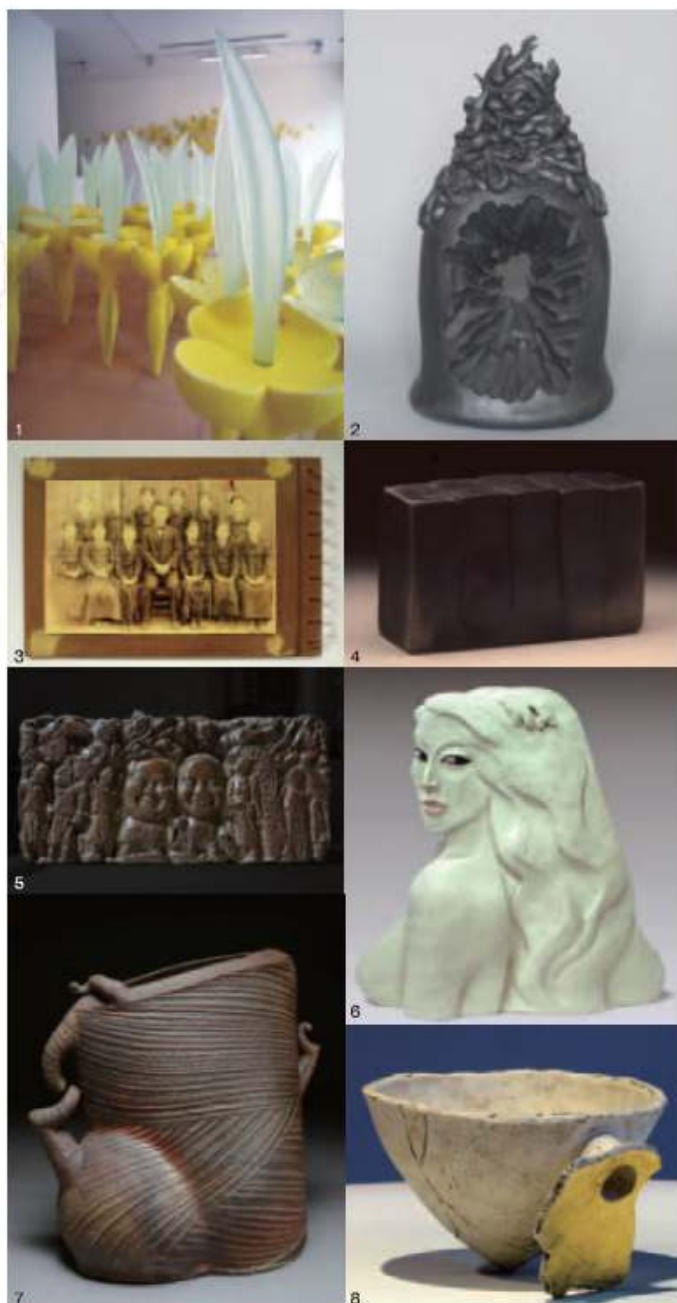
※実際の出品作とは異なる場合があります。