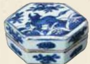
染付 桜川香合 野村美術館蔵