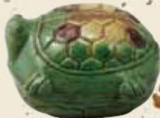
交趾 大亀香合 野村美術館蔵