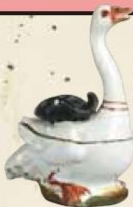
紅毛 白雁香合 徳川美術館所蔵