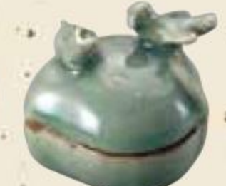
青磁 犬鷹香合 昭和美術館蔵