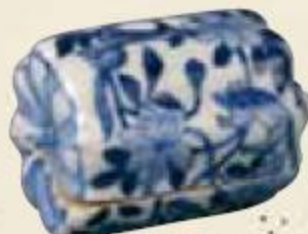
祥瑞 横瓜香合 逸翁美術館蔵