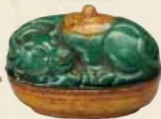
交趾 笠牛香合 野村美術館蔵