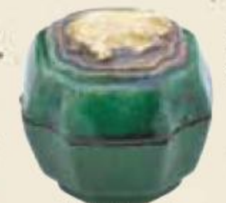
交趾 台牛香合 湯木美術館蔵