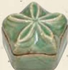
青磁 桔梗香合 泉屋博古館分館蔵