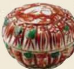
呉洲赤絵 菊兔香合 野村美術館蔵