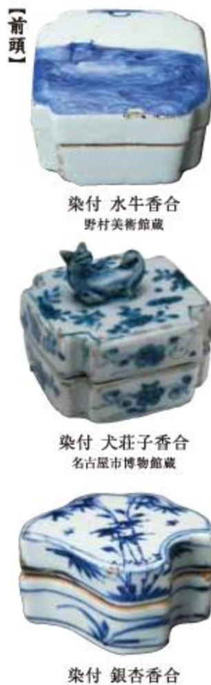
染付 水牛香合 野村美術館蔵