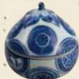
祥瑞 茄子香合 野村美術館蔵