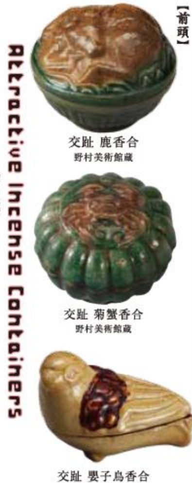
交趾 鹿香合 野村美術館蔵