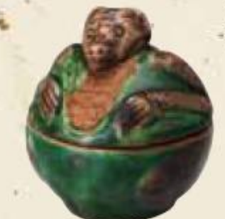
交趾 狸香合 野村美術館蔵