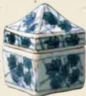
染付 辻堂香合 五島美術館蔵