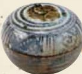
宋胡録 柿香合 野村美術館蔵