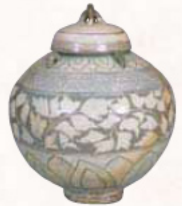
粉青沙器白地落耳耳壺 韓国 朝鮮時代 出光美術館