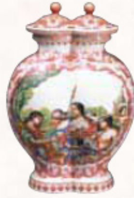
重要美術品 | 磁瑯彩西洋人物文蓮座 中国 景徳鎮窯 清時代-乾隆年間 永青文庫

愛知県陶磁美術館 Aichi Prefectural Ceramic Museum