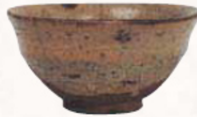
重要文化財 | 茶碗 銘 三宝 日本 唐津 桃山時代 和泉市久保整記念美術館