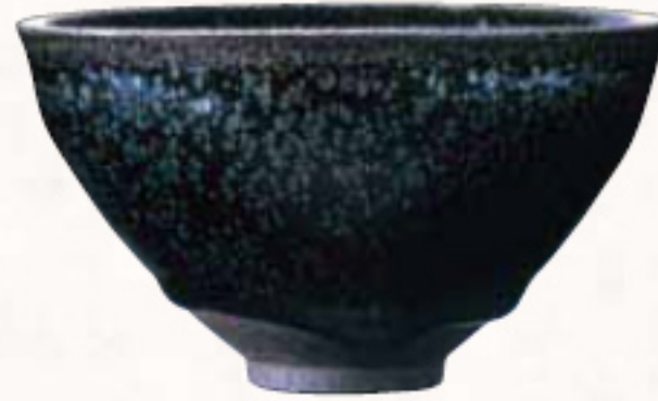
重要文化財 | 耀堂天目 中国 建窯 南宋時代 MHO MUSEUM (展示期間:6月1日[土]—6月16日[日])