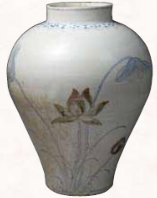
青花辰砂蓮花文壺 韓国 朝鮮時代 大阪市立東洋陶磁美術館

Sense of Beauty : Impressive Masterpieces of the Ceramics of Japan, China and Korea