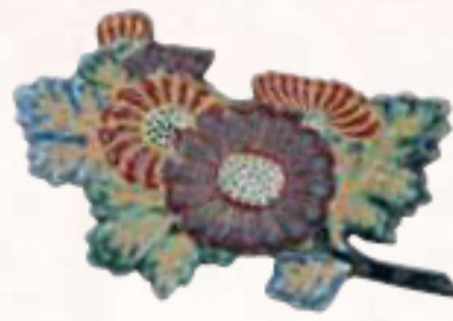
重要文化財 | 色絵釘盤 (上・右) 日本 京都 伝・仁清作 江戸時代 京都国立博物館