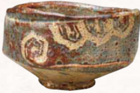
重要文化財 | 風志野亀甲文茶碗 銘 峯紅葉 日本 桃山時代 五島美術館 (展示期間:6月1日[土]—6月30日[日])