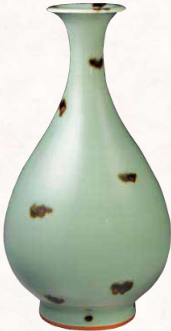
国宝 | 飛青磁花生 中国 磁州窯 元時代 大阪市立東洋陶磁美術館

開館35周年・新名称記念 特別企画展 —日本・中国・韓国— 陶磁の名品、 ここに集う