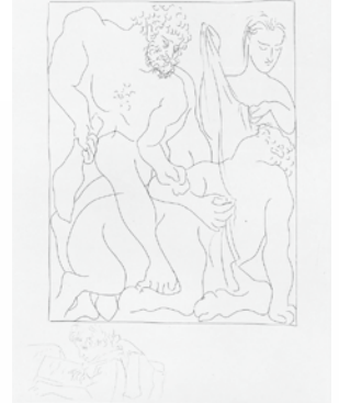
4 © 2015-Succession Pablo Picasso -SPDA (JAPAN)

本展覧会は、近代以降に日本で蒐集されたギリシア陶器(アッティカ地方の黒像式、赤像式陶器や葬送用白地レキュトス、またコリント地方やギリシアの植民地であった南イタリア地方の陶器類)やローマ陶器を中心に、近代日本における「希臘・羅馬」芸術の受容を示す貴重な教育資料、また近代ヨーロッパのギリシア・ローマ風陶磁器、グスタフ・クリムト(オーストリア、1862-1918)やパブロ・ピカソ(スペイン、1881-1973)らモダン・マスター達のギリシア・ローマ芸術に想を得たポスターや版画類など約200点で、古代ギリシア陶器芸術の影響とその意義を概観します。