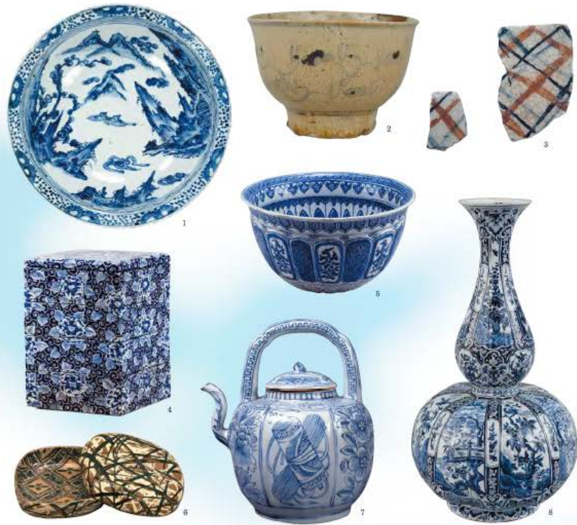
1 | 重要文化財 染付山水図大鉢 日本 肥前・有田窯 17世紀 大和文庫館 2 | 染付花唐草文碗 日本 瀬戸窯 17世紀 京都国立博物館 3 | 鉄絵染付格子文向付片磁器城跡(白鷺中学校)出土 日本 美濃窯 17世紀 姫路市理蔵文化財センター 4 | 藍絵西洋花卉文四段重(「阿蘭陀写」) 日本 京焼系 19世紀(「文政13年」箱書) 神戸市立博物館 5 | 青花牡丹文鉢 ベトナム 15世紀 大和文庫館 6 | 重要文化財 白泥染付金彩文意器 日本 京・乾山窯 尾形深雪(1663-1743)作 18世紀 テントリー美術館 7 | 青花芙蓉手宝篋花弁文手付水注(ヴァッテ・レーウ号複製品) 中国 景徳窯 1613年頃 神戸市立博物館 8 | 藍絵花鳥文瓶形磁器 オランダ デルフト窯 18世紀 愛知県美術館(木村定三コレクション) ※会期中展示替を行います。詳細は公式WEBサイトで御確認ください。

—これは慶長8(1603)年に日本イエズス会によって刊行された宣教師のための日本語・ポルトガル語辞書「 ニッポ 日葡辞書」の一項です。「繪のあるちやわん」、すな