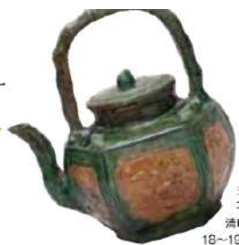
三彩龍文水注 石湾窯 清時代 18~19世紀