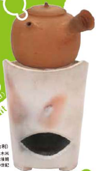
白泥三峰炉(揚名合利) 青木木米 江戸時代後期 19世紀