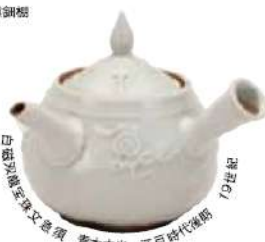
白磁秋意図文水注 青木木末 江戸時代後期 19世紀