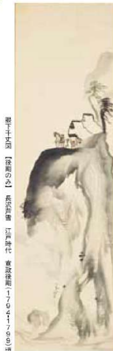
松下野篁【後期のみ】 長沢芦雪 江戸時代 寛政後期(1794~1796)頃