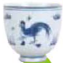
青花鴨文茗碗 景徳鎮窯 明時代末期 17世紀前半