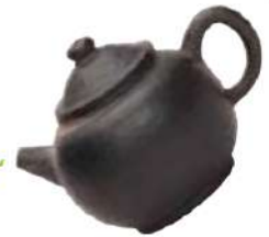
烏泥茶鉢 宜興窯 明~清時代 16~17世紀