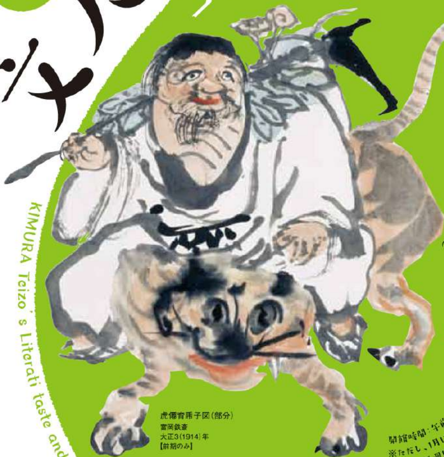
虎保育種子図(部分) 富岡鉄斎 大正3(1914)年 【前期のみ】