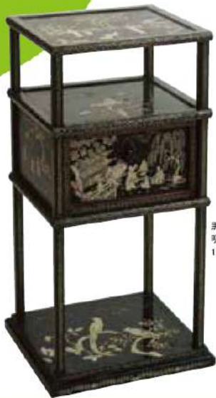
黒漆花鳥人物図螺鈿櫃 明~清時代 16~17世紀