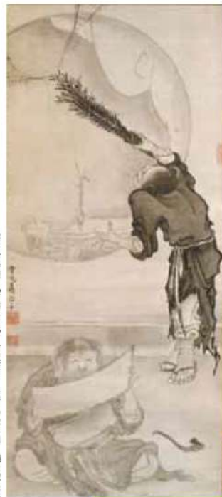
寒山拾得図【前期のみ】 曾我蕭白 江戸時代中期 18世紀後半