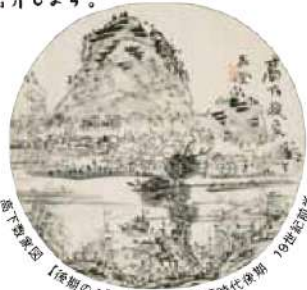
松下野篁図【後期のみ】 浦上玉堂 江戸時代後期 19世紀前半