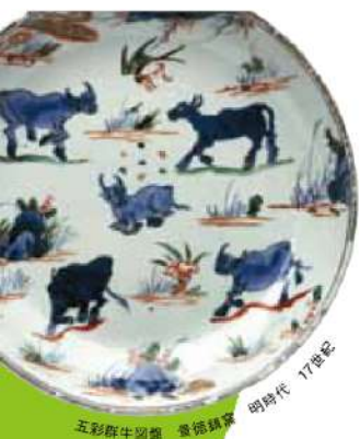
五彩群牛図盤 寛政朝 17世紀

木村定三氏は、名古屋の生んだ卓越した美術蒐集家として知られ、弱冠25歳で熊谷守一のコレクター、以降パトロンとなったことは有名な話です。これまでに愛知県美術館に寄贈されたコレクションは、近現代の美術、江戸時代の絵画、茶陶、仏教美術や考古遺物など3307件にのぼります。本展では、中国黄檗隠元の書をはじめ、康熙帝の硯、浦上玉堂、長沢芦雪、曾我蕭白、富岡鉄斎、小川芋銭、熊谷守一などの作品、文人趣味の漆器や金属器、陶磁器も含めた煎茶道具など、137件と展示します。作品の背景にある中国古典の解説に加え、木村氏の蒐集精神と文人精神の一端を紹介します。