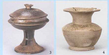
1. 平瓶・灰釉平瓶 須恵器(左:陶邑窯出土、右:猿投窯黒笹7号窯跡出土) 奈良時代~平安時代初期(8世紀) 愛知県陶磁美術館(本多静雄コレクション) 2. 長頸瓶 須恵器(左2点:陶邑窯出土、右端:猿投窯) 奈良時代~平安時代初期(8世紀) 左2点:愛知県陶磁美術館(本多静雄コレクション)、右端:個人蔵 3. 列点文有蓋高杯 韓国 陶質土器(加耶) 三国時代(5世紀) 愛知県陶磁美術館(李吉秀コレクション) 4. 広口壺 須恵器(陶邑窯出土) 奈良時代(8世紀) 愛知県陶磁美術館(本多静雄コレクション)