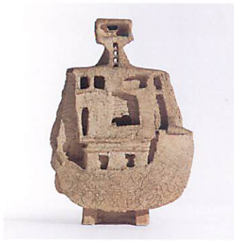
《寒山》1958年 鳥取県立博物館蔵