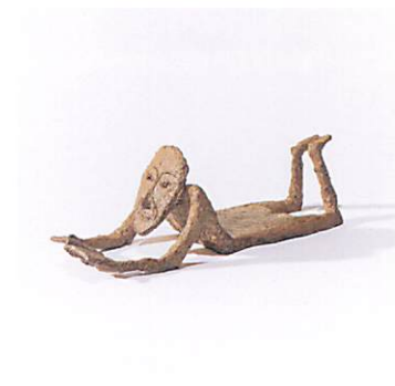
《緑陰讀書》1979年 信州高遠美術館蔵

陶彫による抽象作品で国際的に活躍した彫刻家 辻晉堂(1910-1981)の生誕110周年を記念する展覧会を開催します。