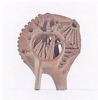
《時計》1956年 京都国立近代美術館蔵