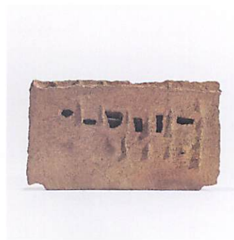
《東山にて》1962年 個人蔵