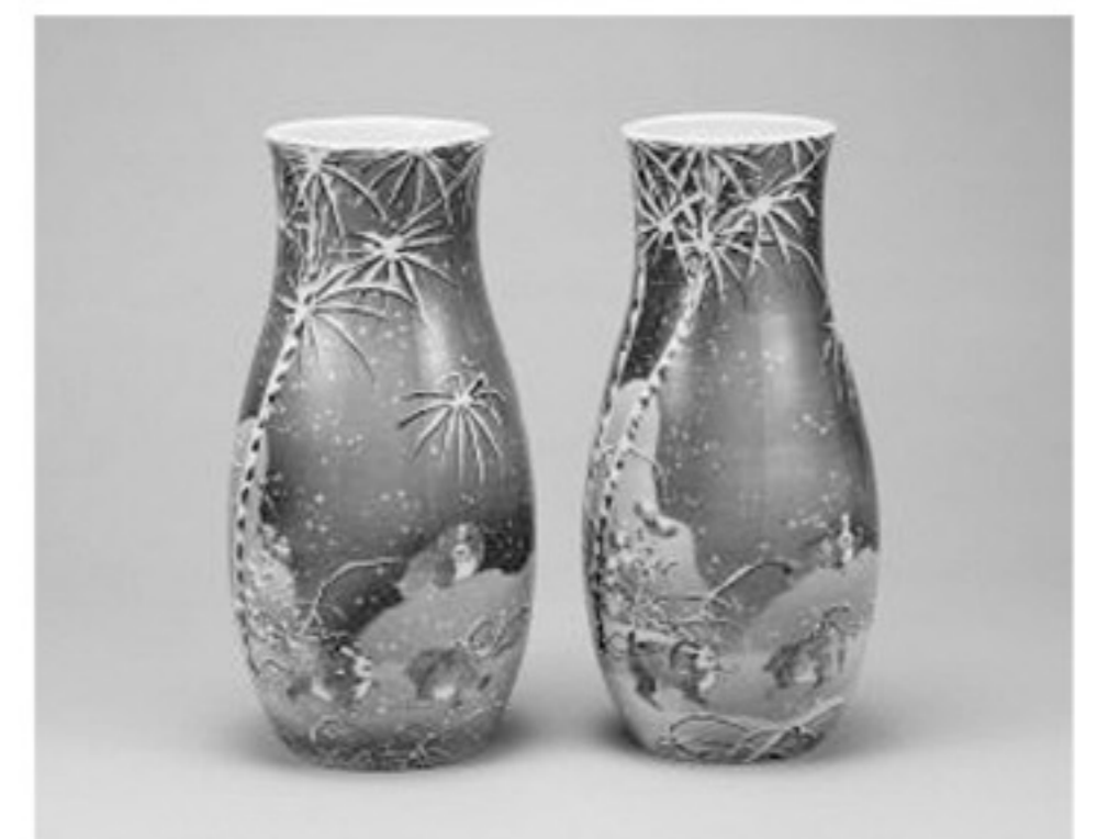
染付雪に子犬図花瓶 瀬戸・川本樹吉 明治時代(19世紀)