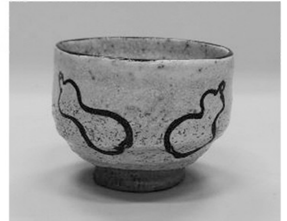
鉄絵瓢箪文茶碗 名古屋・市江鳳造 江戸時代末期(19世紀)