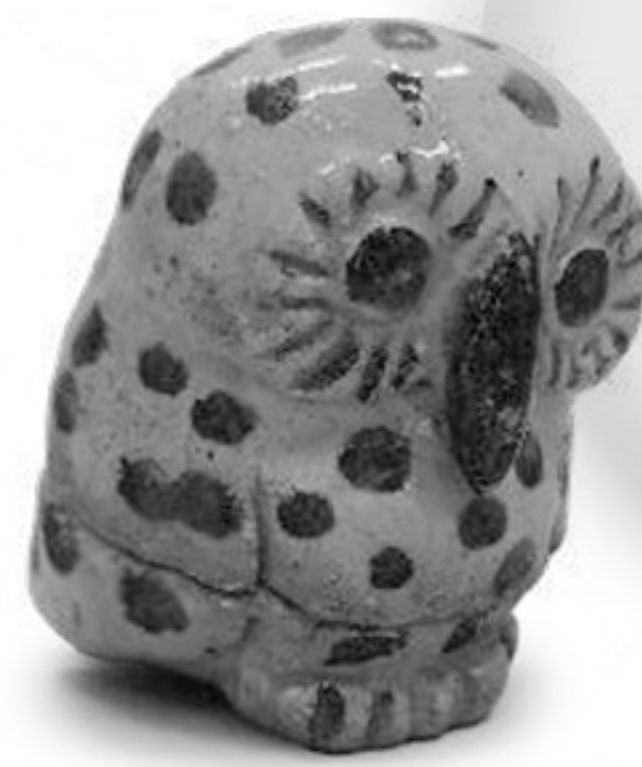
泉楽香合 名古屋・萩山 江戸時代後期(19世紀)(寄託)