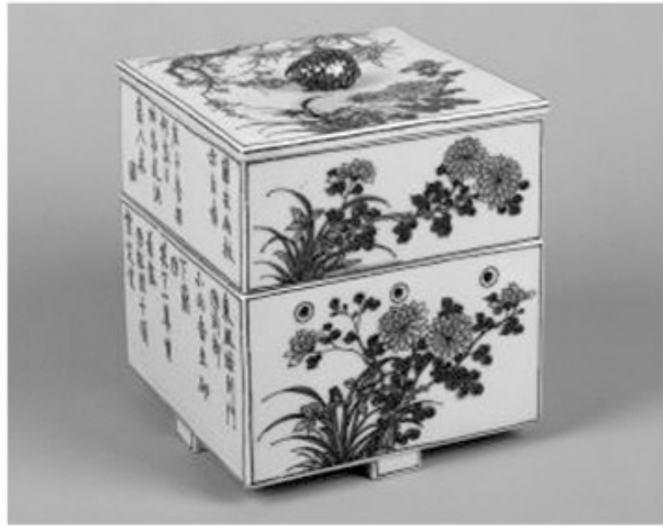
染付詩文四君子文二段重 瀬戸・亀井半二 天保14年(1843)

愛知県は、古来よりやきものづくりが盛んな地域として知られています。中でも5世紀から14世紀にかけて展開した猿投窯は我が国最大の古窯群です。その系譜は瀬戸焼に引き継がれ、また12世紀初めに知多半島に興った常滑焼の成立に大きな影響を与えました。瀬戸と常滑は連続と続き、現在も日本屈指の大窯業地として知られています。「セトモノ」がやきものの代名詞として使われていることは、瀬戸のやきものが広く長く使われてきたことを物語っています。