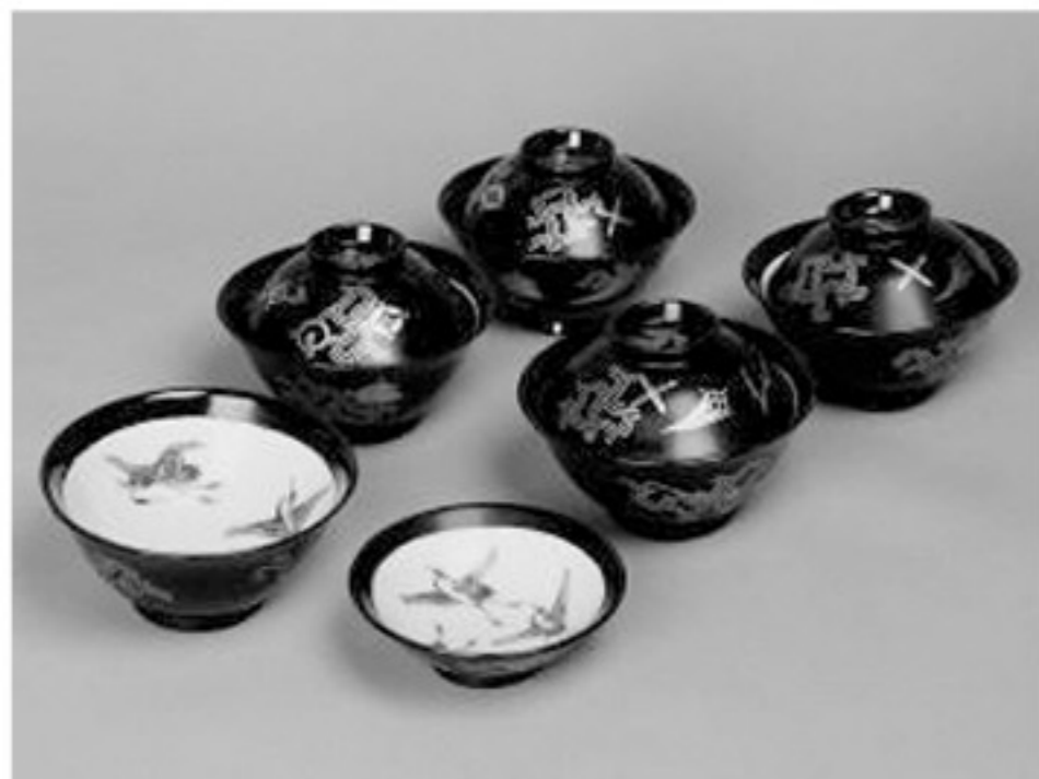
磁胎蒔絵内染付三鶴文蓋付碗 瀬戸・川本半助 江戸時代末期~明治時代(19世紀)