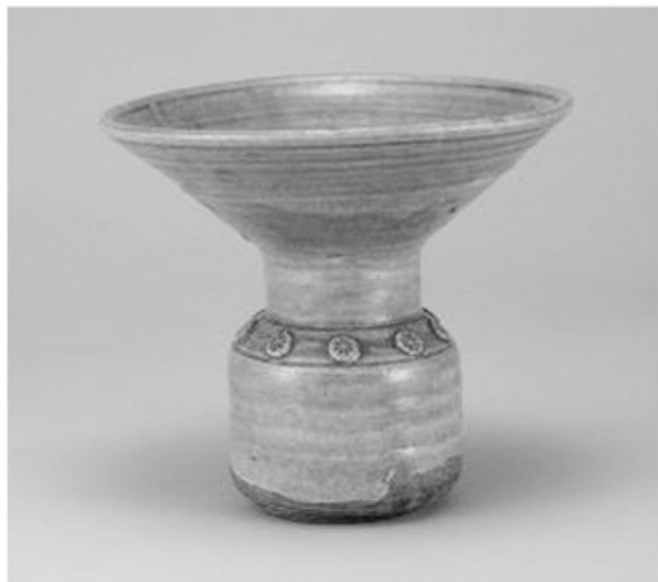
黄瀬戸広口花入 瀬戸・加藤春山 江戸時代後期(19世紀)