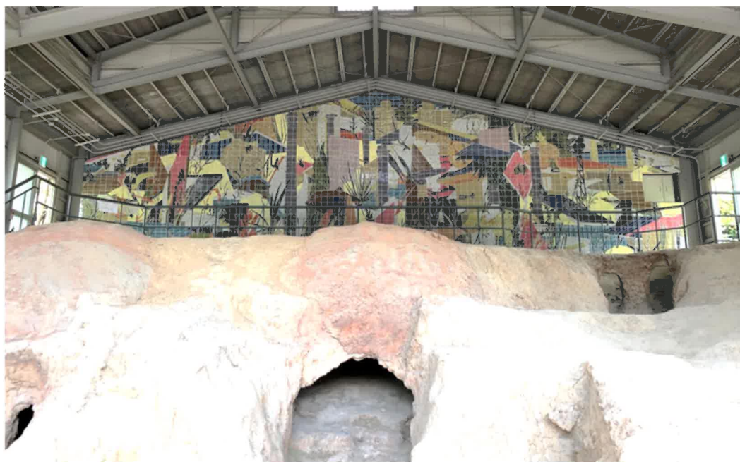
《瀬戸風景2022》川田知志 2022年(撮影 横山将基 よこやまさき )

(※2)丘陵の斜面をトンネル状に掘った窯。掘った後に天井を構築したものや、地中を掘り抜いたものが存在する。この形式の窯は5世紀に朝鮮半島から須恵器の技術とともに日本へ伝播した。