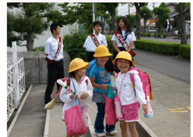
犬山市立犬山西小学校

あいさつ、できていますか？ 中学生のおにいさんおねえさん といっしょにあいさつ運動をして います。