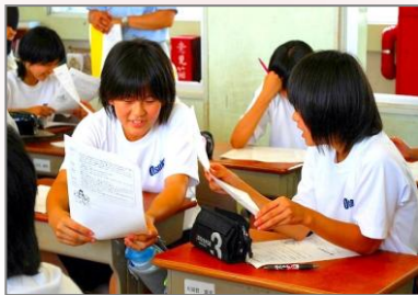
蒲郡市立大塚中学校