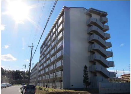
公営住宅等整備事業 整備イメージ