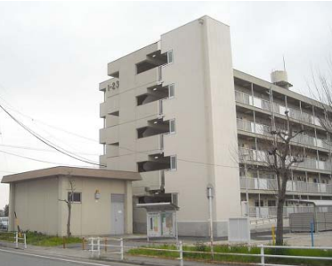
公営住宅等ストック総合改善事業 整備イメージ(EV設置)

愛知県、豊橋市、岡崎市、一宮市、半田市、春日井市、豊川市、津島市、碧南市、刈谷市、豊田市、安城市、西尾市、江南市、小牧市、稲沢市、新城市、東海市、大府市、知多市、知立市、尾張旭市、田原市、みよし市、豊山町、美浜町、幸田町