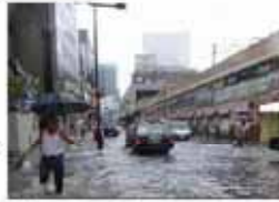
平成25年8月大阪市梅田駅周辺の浸水