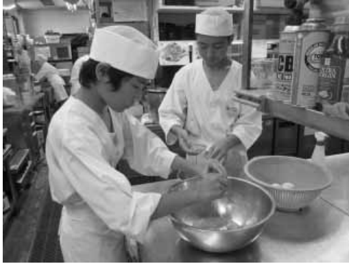
職場体験をしている中学生