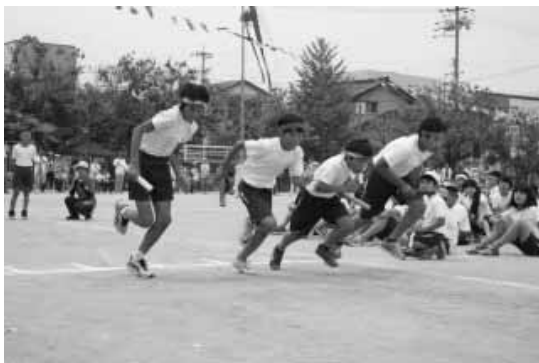
よーい、どん ~ 小学校の運動会風景 ~