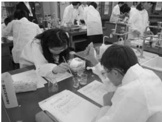
科学で競う中学生 ～「あいち科学の甲子園ジュニア 2015」～