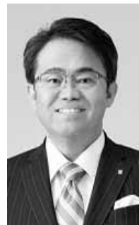
愛知県知事 大村秀章