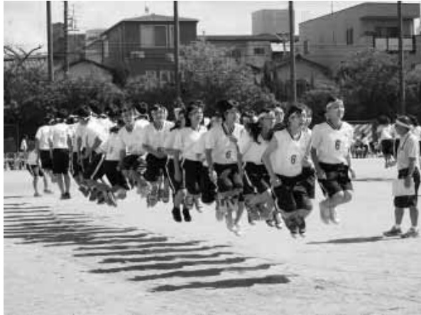
心を一つにして ~中学校の体育祭~