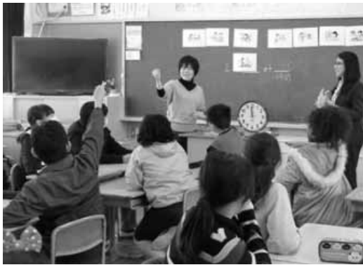
小学校外国語活動の様子