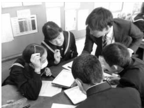
グループで学び合う中学校での授業風景