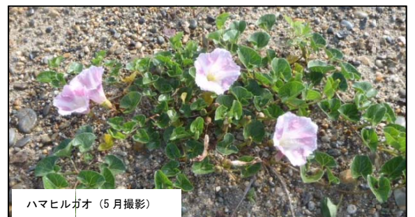
ハマヒルガオ (5月撮影)