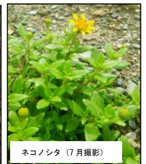
ネコノシタ (7月撮影)