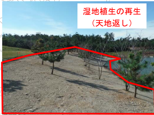
湿地植生の再生 (天地返し)