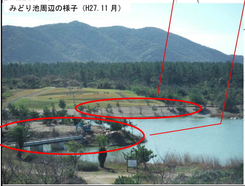
みどり池周辺の様子 (H27.11月)