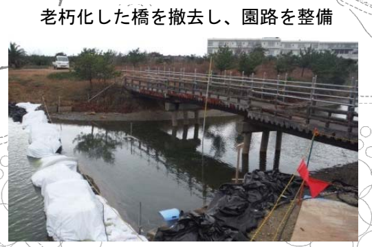
園路改修工 老朽化した橋を撤去し、園路を整備