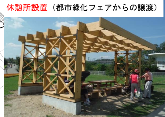
休憩所設置 (都市緑化フェアからの譲渡)