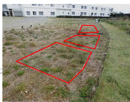
植生管理手法の検討 海水・砂を実験区画に散布し、 外来種の抑制等の効果を観察