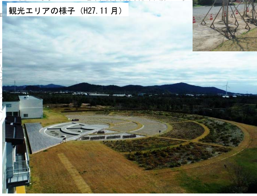
観光エリアの様子 (H27.11月)