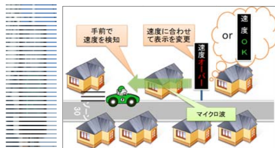
電光掲示板と実証実験の概要

愛知県ITS推進協議会では、この実証実験の検証結果として得られた速度抑制効果等について普及・啓発するため、昨年7月に開催された「市町村交通安全担当者会議」（所管：愛知県県民生活部地域安全課）において実証実験の概要等を報告した。また、同年8月には、県内市町村の交通安全担当者、道路管理担当者等を対象として、電光掲示板（実証実験終了後に刈谷市内に常設）の現地視察会を開催した。