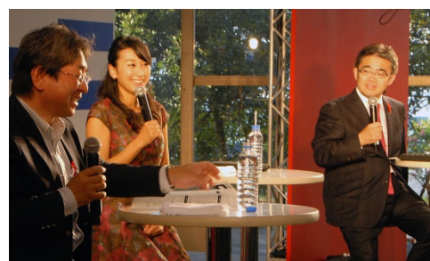
I T S トークショー