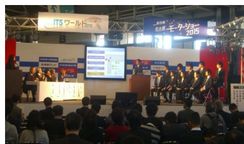
I T S 討論会