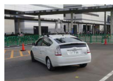
自動運転車の同乗体験