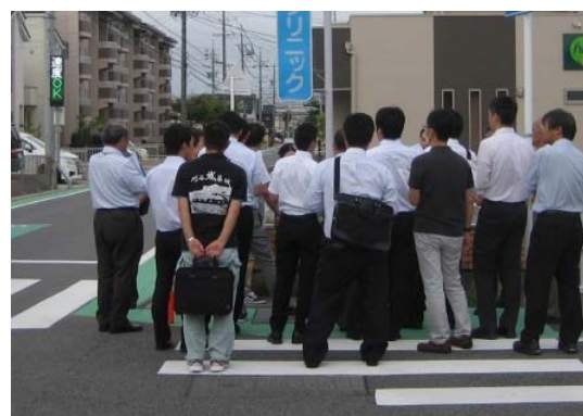
現地視察会の様子（H27.8.26 刈谷市内）