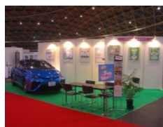
愛知県 ITS 推進協議会ブース