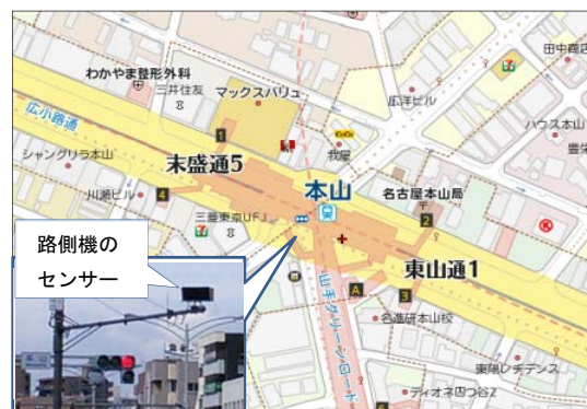
県設置の路側機と整備場所