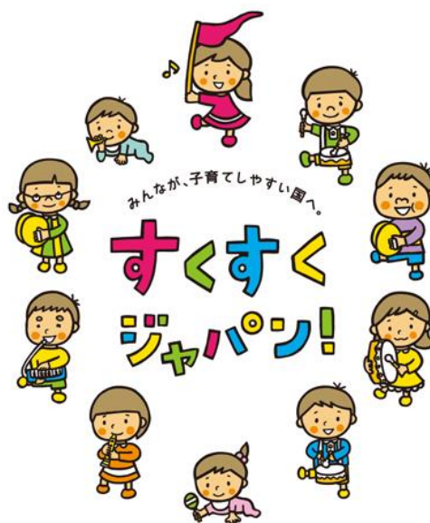
<子ども・子育て支援新制度シンボルマーク>

そこで、スタートしたばかりの新制度が円滑に実施され、すべての子ども・子育て家庭が必要な支援を受けられるよう、本県においては次のとおり取組を進めていきます。