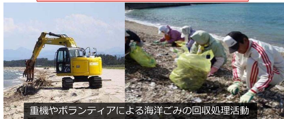
重機やボランティアによる海洋ごみの回収処理活動