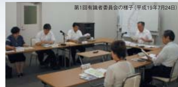
第1回有識者委員会の様子(平成19年7月24日)

みなさまとのコミュニケーションを適切に進めるため、第三者機関である有識者委員会を設置し、中立的な立場からアドバイスをいただくことにしました。今後も、PIの各段階において、必要に応じ委員会を開催します。委員会の内容は広報誌、ホームページ等にて公表します。