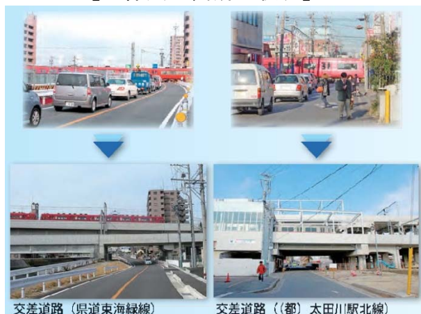
【立体交差箇所の状況】