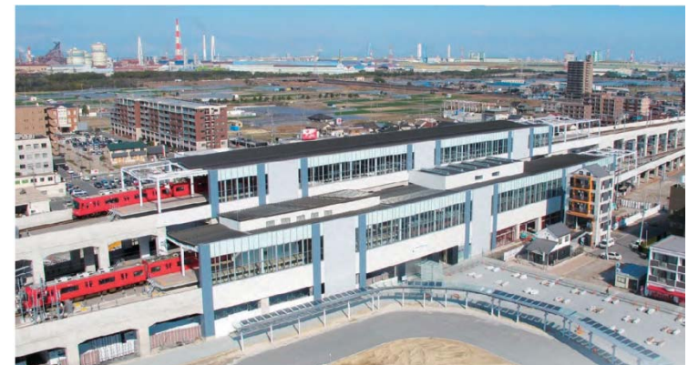
【高架後の太田川駅付近の状況】