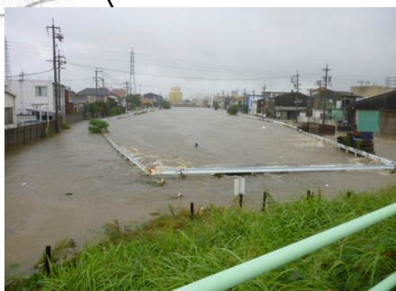
地蔵川の浸水状況(春日井市) 【平成23年9月台風15号時】