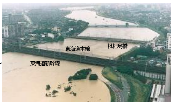
JR東海道新幹線庄内川橋りょう付近 【平成12年東海豪雨時】(名古屋市西区・清須市)