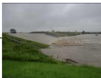
激特事業後初めて越水する洗堰(名古屋市北区) 【平成23年9月台風15号時】