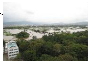
豊川の浸水状況(豊橋市) 【平成23年9月台風15号時】