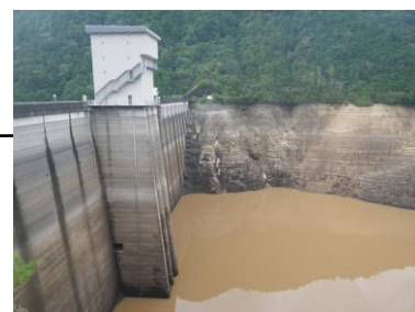
宇連ダムの渇水状況(新城市) 【平成25年9月 貯水率0.8%】