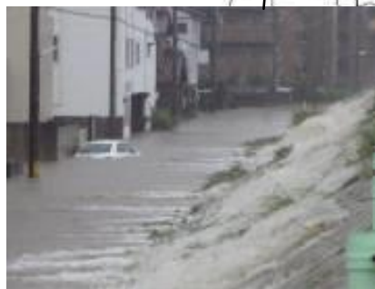
八田川の浸水状況(春日井市) 【平成23年9月台風15号時】