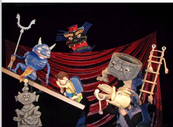
「地獄八景亡者戯～じんたろうとつくも神の巻～」 脚本/麻創 けい子 演出/水草 友士

東海地方初のプロ人形劇団として、東海の児童演劇の創造を牽引してきた。昭和63年に名古屋市芸術奨励賞を受賞した後も、「石の馬」、「西遊記」が中国北京市より招聘され全編中国語で上演するなど、活躍している。平成19年は創立40周年を記念し、「ジョディと子鹿のフラッグと」他2作品を制作。活動は、自主公演、会館主催公演、幼稚園・保育園・小学校公演などで、年間11作品前後、公演回数1000回以上、観客数は約18万人を数える。昭和63年には、国内外より9万人以上が参加した「世界人形劇フェスティバル88」の事務局として中心的役割を果たした。また、愛知児童青少年舞台芸術協会事務局、日本児童・青少年演劇団協同組合理事など要職を務め、地域の文化活動に尽力するなど、本県芸術文化の振興と向上に大きく貢献している。