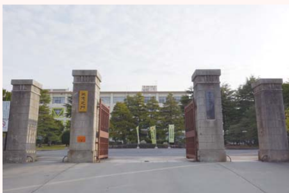
現在の正門（南から）

校地は、名鉄西尾線西尾駅の北西約1.5kmに所在し、正門は校地の南辺中央に位置します。正門は校舎新築に併せて、大正13年(1924)頃新築されたものと考えられています。間口約9.6m、4基の方形の門柱を立て左右に脇門を付けています。門柱は鉄筋コンクリート造洗い出し仕上げで、高さが中央柱は約3.6m、脇柱は約3.2m、柱礎、柱身、柱頭の3つで構成されており、外観は縦横に目地を設け石造表現を行い、柱頭部中央に半筒形を3本(脇柱は2本)並べた抽象表現の装飾が付いています。中央柱には、前身の「蚕糸学校」の「さんし」から採った「三志之門」の表札が掛っています。「花の香高し 鶴城ヶ丘」(校歌の冒頭)に立つ正門は、元気よく登校する生徒を静かに見守っています。