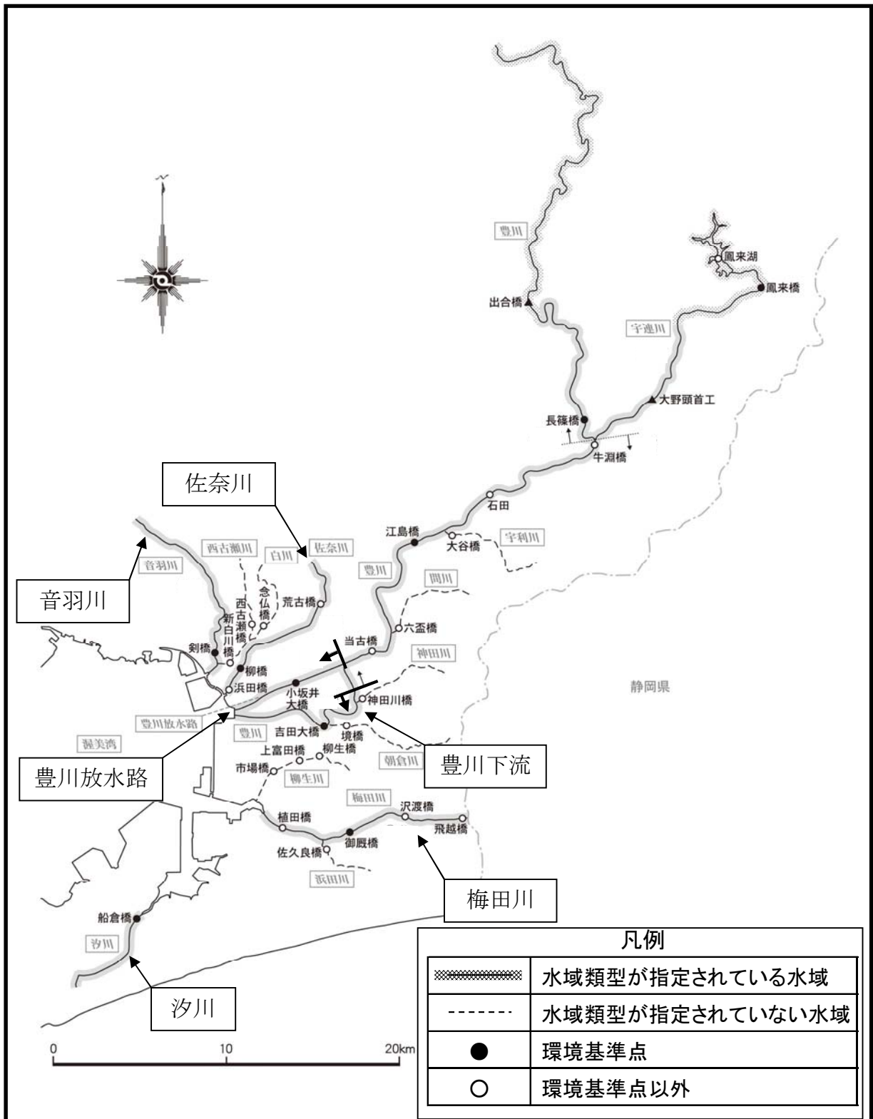
図3 豊川等水域の水域類型を見直す水域