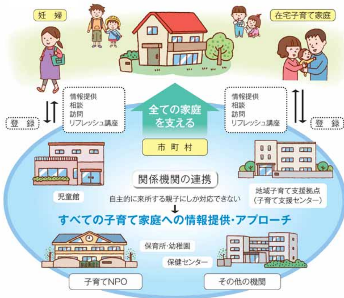
子育て情報・支援ネットワークの仕組み(図 24)