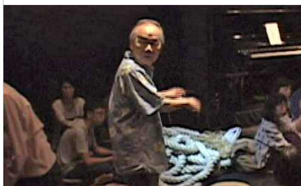
往還Ⅱ 第二夜 朗読劇「ホタル綺譚余滴」でのあいさつ (平成28年)