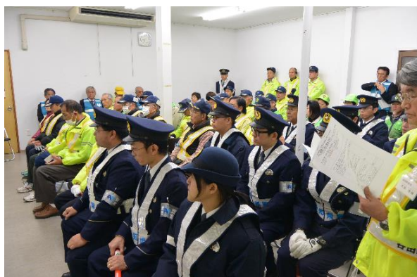
交番の巡査の皆様