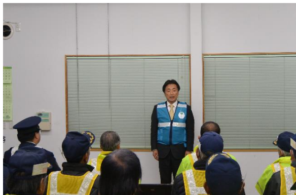
知立市長より激励の言葉

知立市長様 安城警察署長様はじめ来賓の皆様を激励を受け交番の警察官の皆様と身の引き締まる思いで町内をパトロールした。